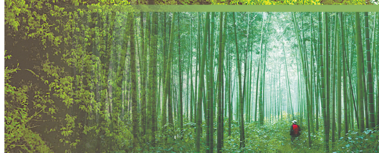
绿色竹海,生态乐安