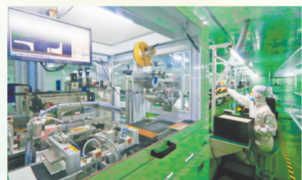
生产手机液晶显示屏的江西拓远科技生产车间一角