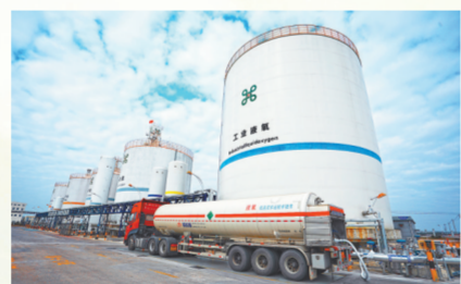
抚州兴邦新能源有限公司厂区一角