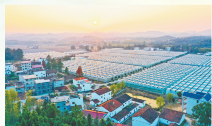
乐安县绿巨人农业潮溪乡小段村的反季节蔬菜基地