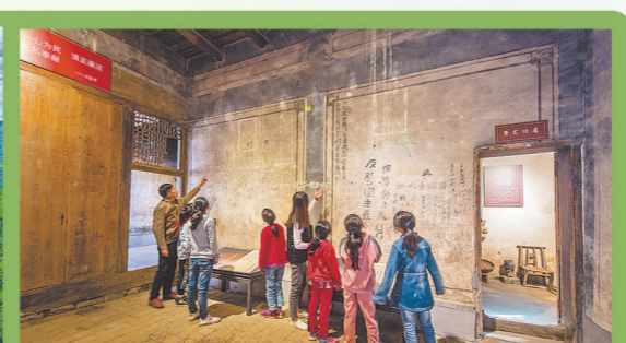
全县3800多条红军标语成为传承红色基因的重要载体