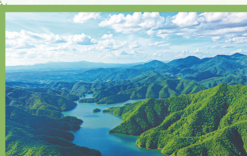
龙潭水库周围的碳汇林郁郁葱葱