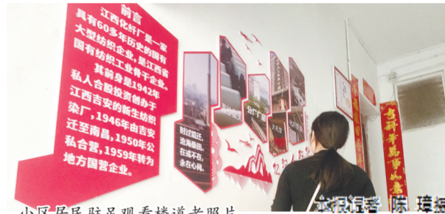
小区居民驻足观看楼道老照片。

近日,南昌市东湖区董家窑街道新华社区江纤小区居民向江西新闻客户端“党报帮你办”频道反映,楼道没有路灯,晚上出行不方便。此外,楼道里环境卫生也较差,希望相关部门能尽快解决。