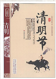
《清明节》 杜尚侠、刘晓峰 著 中国社会科学出版社

本书是《中国民俗文化丛书》之一，主要介绍了清明节的由来、文化品格、墓祭习俗、节日文化等内容，从多个角度讲述清明节习俗及文化内涵。