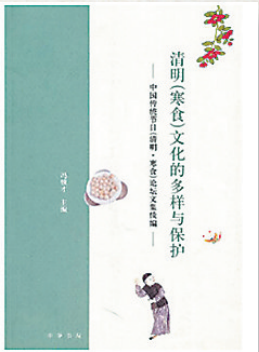
《清明(寒食)文化的多样与保护》 冯骥才 主编 中华书局

前几日，姐姐微信问我，清明节什么时候回去？表面看是一种询问，实则是一种提醒。每年这个时候，回乡祭扫就成了她的一件头等大事。一个出了嫁的女人，预示着离原乡从此渐行渐远，双亲去世后，清明更是成了她回乡最好的理由。每次回乡祭扫，就会背着一大包的东西。她小小的个子，却扛着一个大大的包，还得倒几趟班车，路上的艰辛可想而知。祭扫时，她要在双亲的墓前摆上许多东西，烧三根线香，点上蜡烛，再洒上一盅酒，然后拜一拜，那里面有她对亲人的思念和对生活的祈愿。她的认真与对清明的执念时常让我感动。