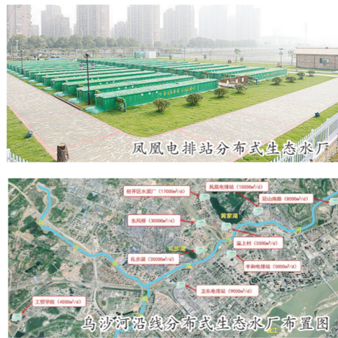
凤凰电排站分布式生态水厂

千里赣江，奔流到英雄城南昌，无论是春江潮涌的雄浑，或是秋水长天的诗意，都为这座生态城市增添了生机与活力。 作为赣江的一条重要分支，分布于赣江下游左岸的乌沙河为千里赣江的绿色奔流肩负重任。乌沙河水系流经湾里、新建、红谷滩、南昌经济技术开发区等区域，此前曾一度出现垃圾填埋场渗透液、龙潭水渠黑臭