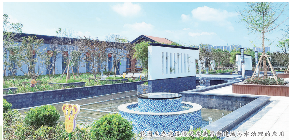
花园生态建设模式在南昌新建城污水治理的应用

小桥流水、芳草萋萋、湖光粼粼，四栋明清建筑内的武宁县水生态循环净化处理厂成为一幅动态山水画卷。 走进武宁县水生态循环净化处理厂，只见污水处理工程的主要工艺处理都集中在一座地埋式的建筑中，而地面则打造成了生态景观公园。 “该项目土地节约集约利用效果显著。如果按照常规地上平铺建设则需占地60亩，采用地埋式技术后，整个厂区用地面积仅为17.5亩，比原选址面积节约土地70%。此外，从建设成本看，水生态循环净化处理厂比采用传统技术建设全地下式污水厂节省投资40%至60%；从运营角度看，污水处理成本比国内同等污水厂节省20%左右。”武宁县住建局相关负责人介绍。 “地埋式污水厂封闭性强，辅以最先进的生物除臭系统，有效控制了臭气排放，改善了污水处理厂的环境。此外，污水处理厂还利用兼氧膜生物反应器技术(即FMBR技术)，实现在单一控制环节内同步降解生活污水中碳、氮、磷及有机剩余污泥，日常运行过程中外排有机剩余污泥较传统技术大幅减少。”负责武宁县水生态循环净化处理厂整体运营的江西金达莱环保股份有限公司相关负责人说。 “武宁县城镇生活污水提质增效三年行动实施以来，紧紧围绕‘三个基本消除，一个显著提高’总目标，做到规划全覆盖、管网全覆盖、收集全处理。”武宁县委相关负责人自豪地说，在原2万吨提标改造的基础上，现扩容建成的武宁县水生态循环净化处理厂可满足今后10至15年城市发展需求。