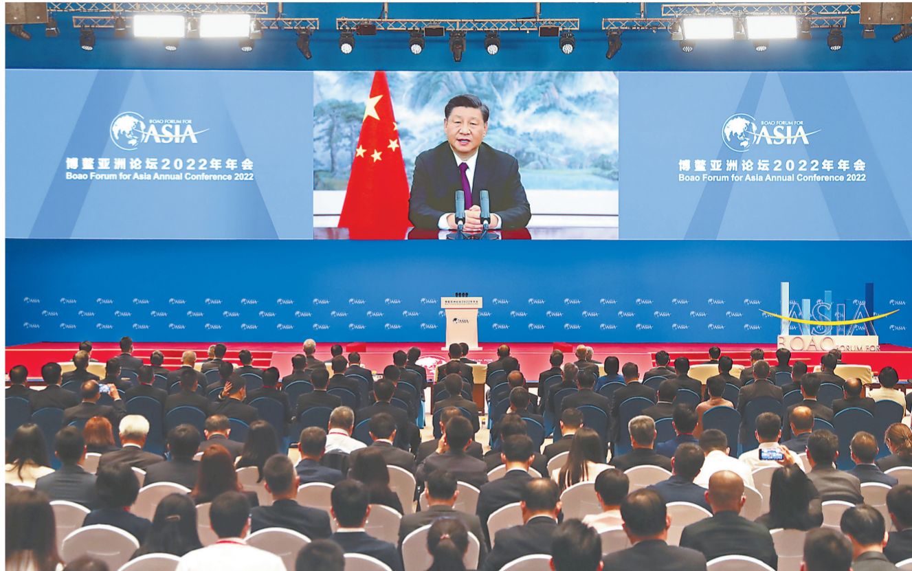
4月21日上午，博鳌亚洲论坛2022年年会开幕式在海南博鳌举行，国家主席习近平以视频方式发表题为《携手迎接挑战，合作开创未来》的主旨演讲。

■ 当下，世界之变、时代之变、历史之变正以前所未有的方式展开，给人类提出了必须严肃对待的挑战。人类历史告诉我们，越是困难时刻，越要坚定信心。任何艰难曲折都不能阻挡历史前进的车轮。面对重重挑战，我们决不能丧失信心、犹疑退缩，而是要坚定信心、激流勇进