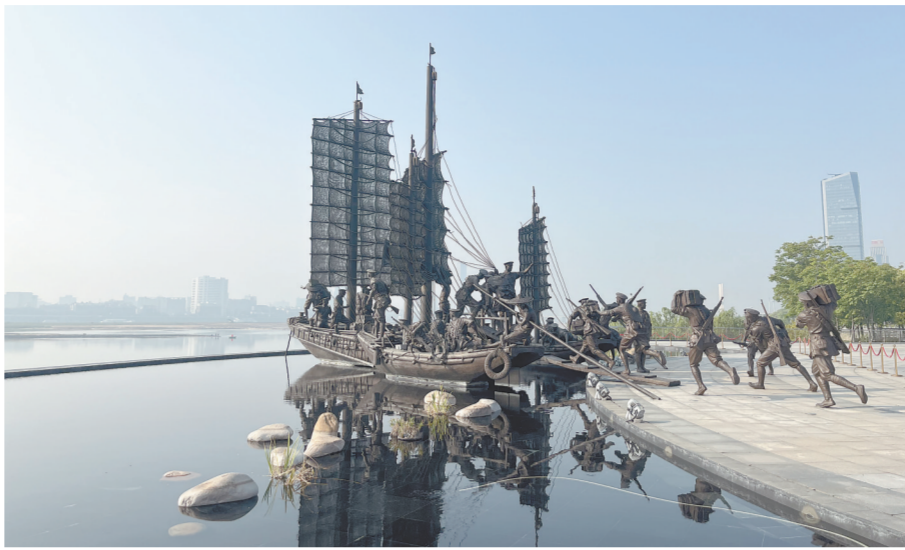
矗立在南昌建军雕塑广场上的“挥师渡江”雕塑。

而就在同一天,南昌市发布了新的城市形象LOGO,该LOGO由“八一”和“南昌”两部分组成,取名为“飞阁流丹”,源自《滕王阁序》中“上出重霄,阁阎流丹”的描述;“八一”二字形如飞檐翘角,上出重霄,