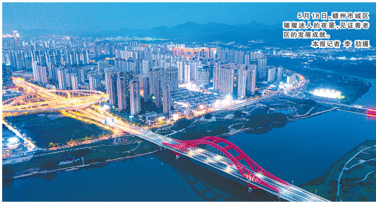
5月18日，赣州市城区璀璨迷人的夜景，见证着老区的发展成就。