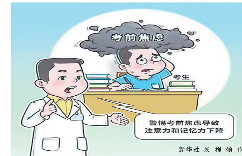
新华社 发程 硕作