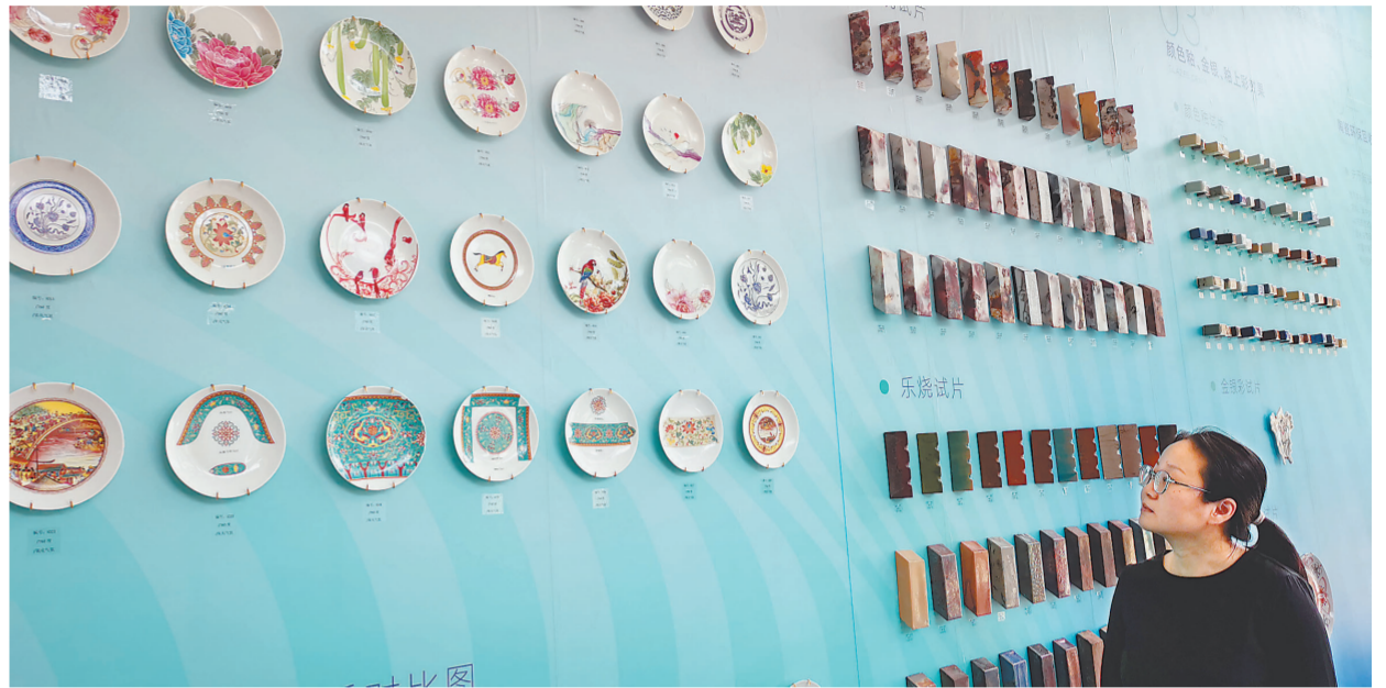
洛客谷陶瓷智造中心的智能打样产品引人关注。