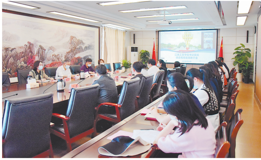
学院举办访企拓岗促就业云端推介会