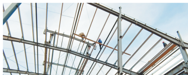
工人们正在紧张施工。

本报樟树讯(记者付强 通讯员虞雾昕)“自从去年12月落户樟树市临江镇以来,我们仅用2个月就完成了签约、立项、土地报批等前期工作,目前厂房主体正在建设,很快就能投入使用。”近日,江西晶海再生资源有限公司相关负责人通过江西新闻客户端“党报帮你办”频道致谢当地政府的贴心服务。今年以来,为高效推进重点项目建设,临江镇从项目引进、落户、开工、建设、投产等各环节全程跟踪服务,积极破解项目用地、资金短缺、用工紧缺等难题,为“强攻二季度,确保双过半”提供项目支撑。