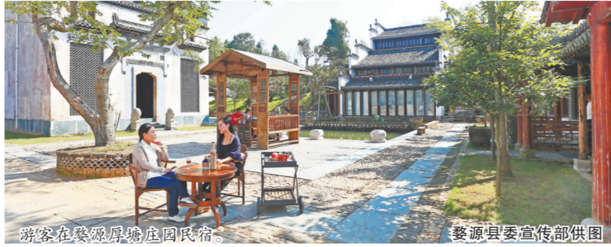
游客在婺源屏峰庄园民宿。

宿单打独斗的状况,共同打响“婺源乡宿”品牌。县政府构建全方位、立体化的宣传营销体系,在线上运营、营销推广、客户服务和线下物流配送、房间保洁、员工培训等方面形成了一个完整的生态闭环,提高了品牌美誉度和市场竞争力。