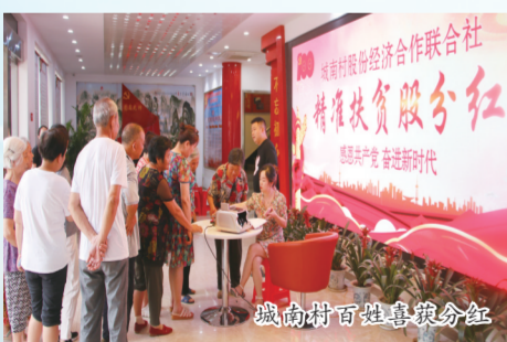
城南村百姓喜报分红

今年5月,工信部公布第三批第一年建议支持的国家级专精特新“小巨人”企业名单,南昌市有2家企业上榜,其中位于青云谱镇前万村产业大楼的江西中德生物工程股份有限公司成功入选。作为一家从青云谱起步进军全国的乡土企业,做强做大后再次回归是该镇产业转型升级的一个缩影,更是