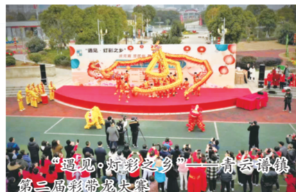
“遇见·灯彩之乡”——青云谱镇第二届彩带龙大赛

今年3月中旬,青云谱镇举行招商引资项目集中签约仪式,成功落地“颐高数字经济产业园”等4个重大项目,立项总金额约10亿元,建成投产后预计每年可产生税收近亿元。同时,结合“转作风、优环境”“民情家访”“阳光驿道”“青云协商·委员面对面”等活动,加强与企业的沟通联系,解决企业实际问题,疫情期间为辖区中小企业减免租金80余万元,申请低息贷款3000多万元,栽好亲商安商“梧桐树”。