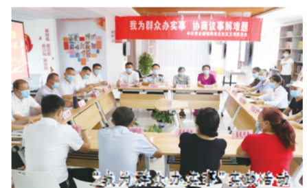
为民办实事 协商议事解难题

今年3月中旬,青云谱镇举行招商引资项目集中签约仪式,成功落地“颐高数字经济产业园”等4个重大项目,立项总金额约10亿元,建成投产后预计每年可产生税收近亿元。同时,结合“转作风、优环境”“民情家访”“阳光驿道”“青云协商·委员面对面”等活动,加强与企业的沟通联系,解决企业实际问题,疫情期间为辖区中小企业减免租金80余万元,申请低息贷款3000多万元,栽好亲商安商“梧桐树”。