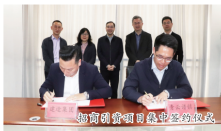
招商引资项目集中签约仪式

今年5月,工信部公布第三批第一年建议支持的国家级专精特新“小巨人”企业名单,南昌市有2家企业上榜,其中位于青云谱镇前万村产业大楼的江西中德生物工程股份有限公司成功入选。作为一家从青云谱起步进军全国的乡土企业,做强做大后再次回归是该镇产业转型升级的一个缩影,更是