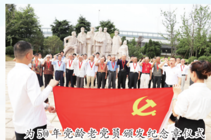
为50年党龄老党员颁发纪念章仪式

栉风沐雨谋发展,砥砺前行赋华章。今日的青云谱镇,正把握机遇,乘势而上,在百舸争流的发展大潮中乘风破浪,以敢干敢拼的精神、创新发展的意识、攻坚克难的韧劲、握指成拳的合力,聚力奋勇争先。“产业强镇、宜居新镇、首善名镇”的美好画卷正在徐徐展开!