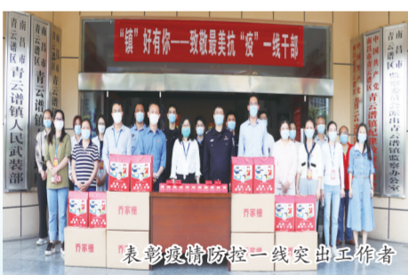
表彰疫情防控一线突出工作者

2021年,新一届镇领导班子上任以来,青云谱镇紧紧瞄准“产业强镇、宜居新镇、首善名镇”目标定位,聚焦“一轴一城四区”产业发展总体格局,以“点线面圈”模式绘就新时代乡村振兴新画卷,力争在中部地区乡镇发展中争先进位。