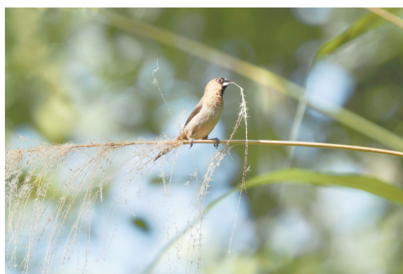
7月10日,在南昌市湾里管理局梅岭国家森林公园内,白腰文鸟正在啄取苕子用于筑巢安家。白腰文鸟并无特别的产卵季节,每年却有3个月的产卵期,一次可下五六个蛋。本报记者 涂序理摄

围绕助力新余打造“全国民生城市知名地”目标,该市残联注重从深化认识、健全机制、体验督导、监督维护等方面,推进无障碍环境建设高质量发展,组织30余名无障碍设施体验队队员分赴各片区,对市直及各县区的政务大厅、公共文化馆、商场超市、宾馆饭店等公共场所的无障碍设施亲身体验,对梳理的129个可及时整改的问题,市文明委、市残联下达整改通知书110份至体验督导单位。目前,已陆续接到51家单位的整改反馈书。