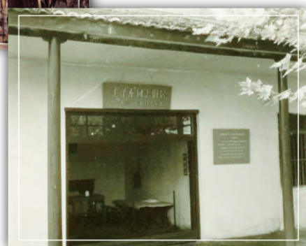
中共安源地委旧址