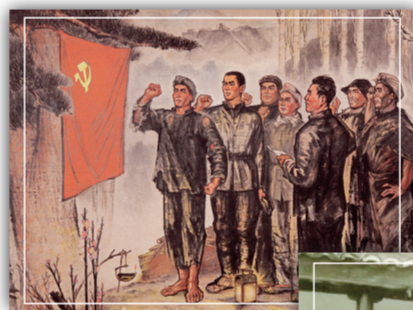
木版画——《入党誓言》再现百年前中共安源路矿支部成立的场景