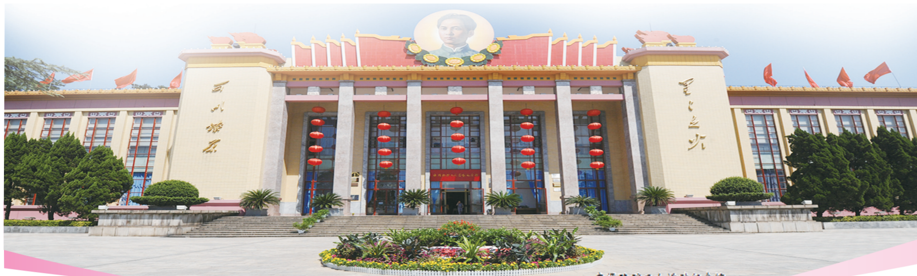
安源路矿工人运动纪念馆