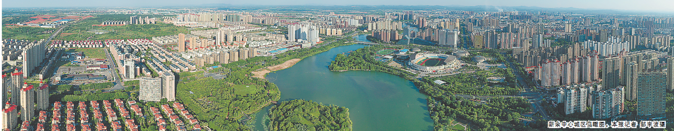
新余中心城区鸟瞰图。