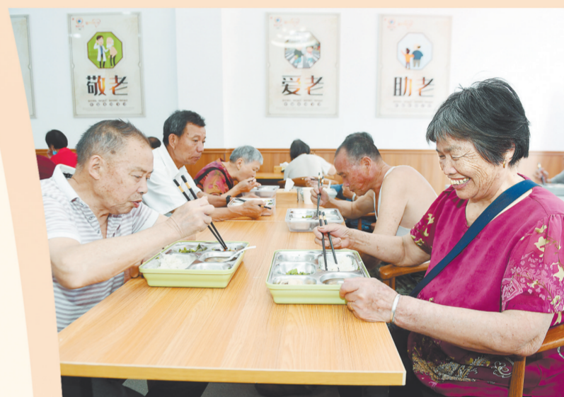
渝水区城北街道暨阳社区颐养之家内，老人们开心地吃午饭。