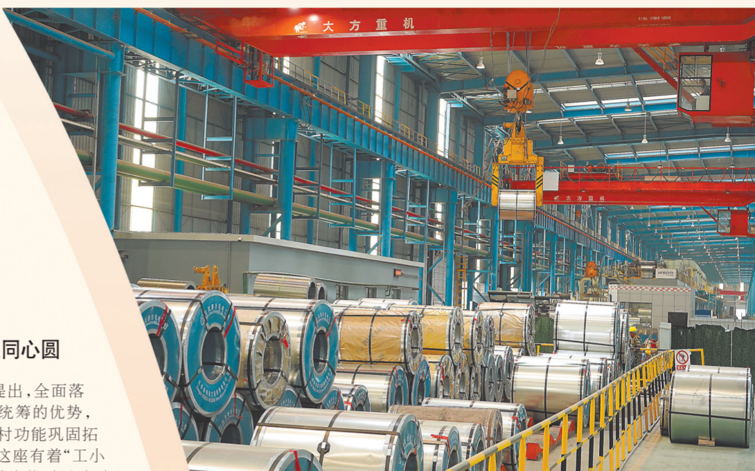
新钢公司硅钢事业部生产车间，工人正在操作行车吊运钢卷。

十年来，新余着力完善城乡基础设施，有效破除城乡二元结构。从全域推进城乡供水一体化，到因地制宜建设农村直饮水站，让农民和市民同喝一碗放心水；从推动“四好农村路”提质增效，到修建环城路串起美丽乡村风光带；从加快城乡基本公共服务一体化，到均衡城乡教育、医疗、养老等资源分配……新余正画出城乡融合发展最大同心圆，让广大人民群众共享经济社会发展成果。