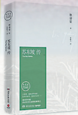
▲《苏东坡传》林语堂著 湖南人民出版社