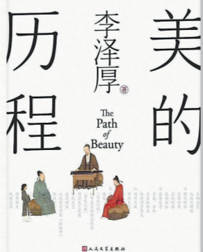
▲《美的历程》李泽厚著 人民文学出版社

什么是美？每个人或许都有着不同的理解，它或抽象、或具象，或理性、或感性……人们对美的追寻和探索也从未停止。在《美的历