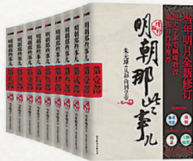
▲《明朝那些事儿》当年明月著 北京联合出版社