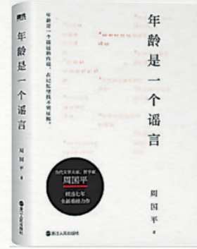
▲《年龄是一个谣言》周国平著 浙江人民出版社