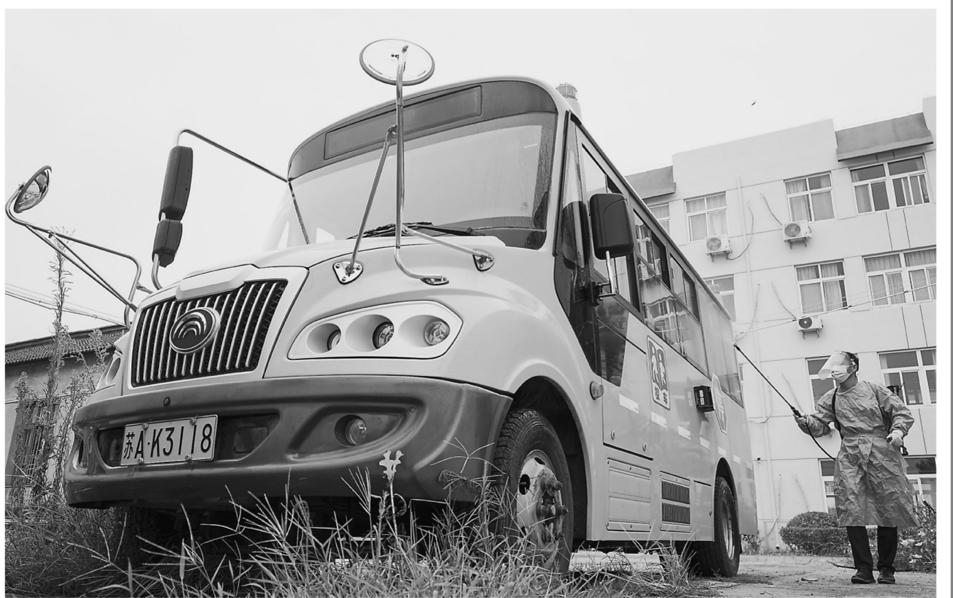
▶ 工作人员在南京一所中学内对校车进行消杀。

(上接第1版)目前,该区正深入推进数字经济做优做强“一号发展工程”,依托大数据产业园,争创国家数字经济创新发展试验区。