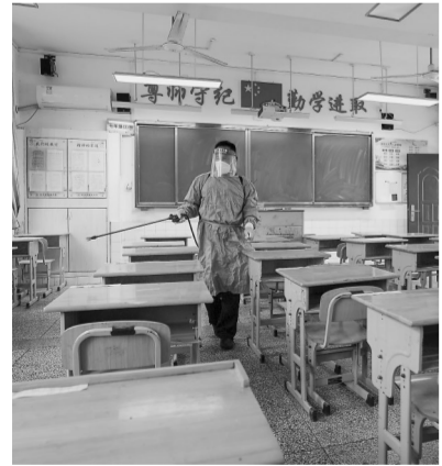
▲ 8月27日,工作人员在南京一所中学的教室内进行环境消杀。