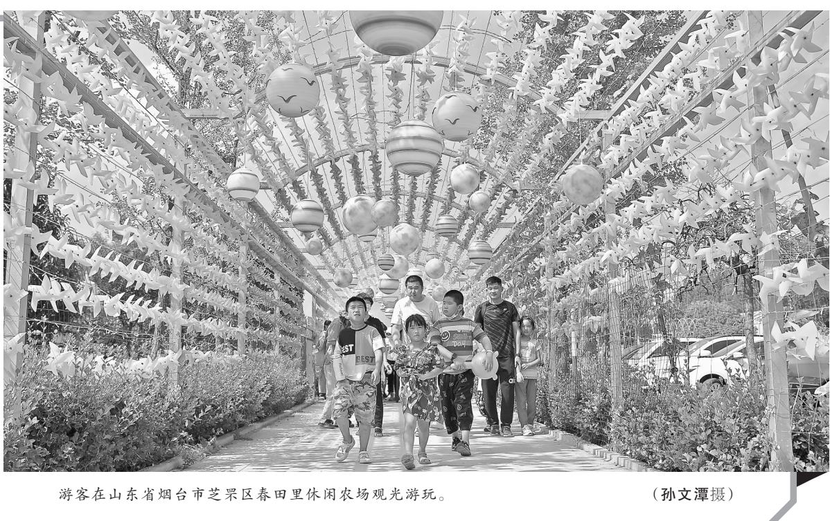
游客在山东省烟台市芝罘区春田里休闲农场观光游玩。