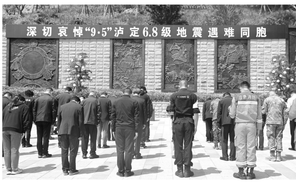
在雅安市石棉县，参加悼念活动的人员为遇难同胞默哀。