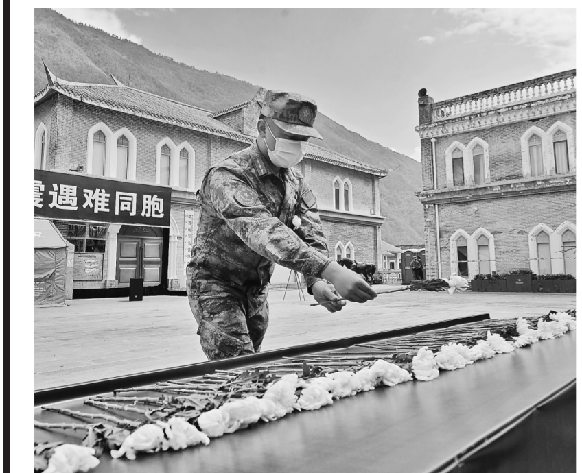
在泸定县磨西镇，参加悼念活动的人员向遇难同胞献花。