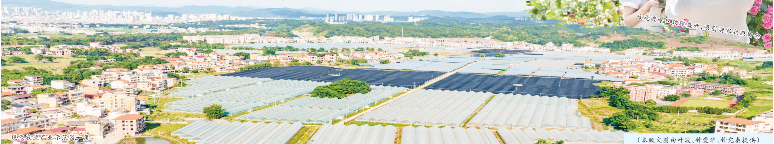
现代农业产业园一角

产的业态链条共享，在共享引领共建中的产业互补产生蝶变效益。今年夏季，渡江镇新大村的火龙果、蓝莓还来不及采摘，就被广东游客抢订一空。“老屋复活”的玫瑰花渡江和黄花湾经济呈现聚变和裂变态势，一幅崭新的乡村振兴大幕彻底拉开。