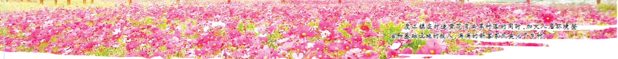
渡江镇在打造宜居美丽乡村的同时，加大人居环境整治和基础设施的投入，满满的“新客家”风貌美化了乡村。