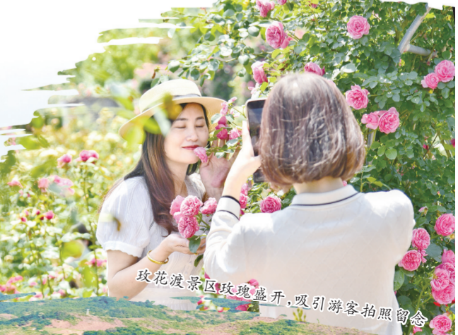
玫瑰花渡江景区玫瑰盛开，吸引游客拍照留念

感恩奋进新征程，砥砺前行向未来。2.39万渡江人民将更加紧密地团结在以习近平总书记为核心的党中央周围，聚焦“作示范、勇争先”目标要求，大力弘扬“团结协作、诚信正义、敢闯爱拼、尚先善赢”的龙南围屋文化，“嗷嗷叫”向前冲、“活跳跳”往上跳，奋力开创“兴盛渡江、秀美渡江、人文渡江、幸福渡江”新局面，为加快建设“强旺美福”明珠市贡献渡江力量，以优异成绩迎接党的二十大胜利召开。