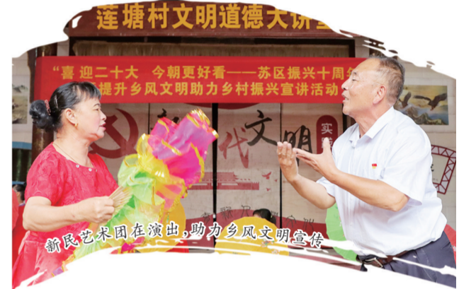
新民艺术团在演出，助力乡风文明建设

同时，渡江镇坚持将党风廉政建设融入日常、抓在经常，定期发送廉洁提醒短信、开展廉政警示教育，落实干部关心关爱、容错纠错、澄清正名等机制，为担当者担当、为实干者撑腰。在提升干部素质方面，该镇利用干部轮流讲学平台，培养理论“先锋”；还通过开展结交农民朋友活动，帮助解决群众实际问题来培养服务“先锋”。