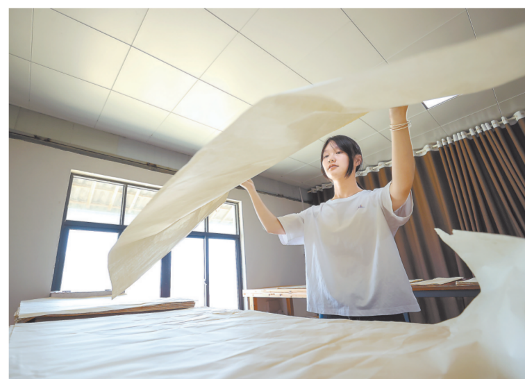
检纸师傅将纸一张张翻开,把不合格的纸挑出来。

近年来,为了让连四纸从“活起来”到“火起来”,铅山连四纸发展有限公司投资3000余万元,打造连四纸生产基地,并加大产品研发、文旅融合等方面的力度,让传统纸张与现代生活完美结合。目前,连四纸年产量达8万刀,产值过亿元。连四纸的灿烂历史得以续写。