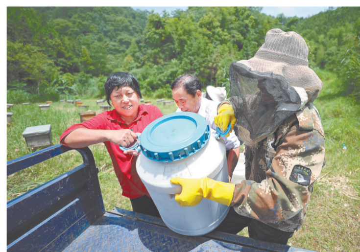
将成桶的蜂蜜搬上丰,运回铜鼓。