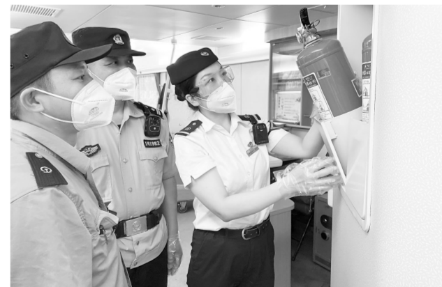
10月1日,K1019次九江至深圳东列车上,列车长正组织乘警、车辆检车员检查列车消防器材,确保列车运行安全。

该集团纪委强化精准监督,制订《关于开展营商环境领域腐败和作风问题专项整治的实施方案》,并将各下属单位开展整治的实际成效纳入年度党风廉政建设考核。出台政商交往的10条正面清单和10条负面清单,厘清政商交往边界,构建亲而有度、清而有为的亲清政商关系。同时,集团各级纪检监察机构还向参建单位和合作单位发放致企业的一封信,发送廉政短信,走访合作企业,主动征集排查问题线索,进一步拓宽信访举报监督渠道。此外,该集团纪委还将成立专项督查组,持续下沉企业一线,从严从重查处故意刁难、吃拿卡要、“小鬼难缠”、利益输送等破坏营商环境的行为,切实为集团高质量发展保驾护航。