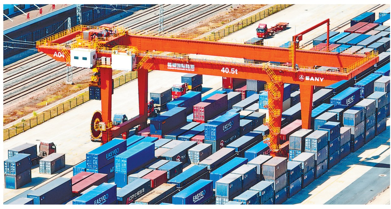
假期货运忙 10月1日,在赣州国际陆港,龙门吊来回作业,集装箱货柜整齐码放。国庆假期,赣州国际陆港工人坚守集装箱吊装调度工作一线,助力赣南“智造”的家具、灯饰、服饰产品销往海内外。

本报记者 钟秋兰 参与这次“奋进新时代”主题成就展解说工作,让她既兴奋又倍感压力。20多页2万多字的解说词,一个细小的语气助词都不能出错。为了能够熟练掌握,管雅丽和解说员们常常背词到凌晨。管雅丽告诉记者,只有能够与展板上的每一张图片、展柜中的每一件实物“对话”,才能真正讲好中国故事,讲好江西故事。成就展开幕以来,每天来自全国各地的观众非常多。面对不同的观众,每一次讲解,都让讲解员对江西的非凡成就多了一层新认识,自豪感、成就感愈发强烈。此次展览,江西单元重点突出了我省十年来取得的成就。观众欣喜发现,江西大力推进数字经济做强“一号发展工程”,VR、物联网成为江西高质量发展新名片。同时,航空、电子信息、装备制造、中医药、新能源、新材料等六大优势产业不断壮大,产业能级进一步提升。这使得不少江西籍观众在展厅频频驻足停留,感叹十年来江西发展速度迅猛,家乡面貌焕然一新。他们纷纷表示:“看到江西发展得这么好,心里觉得又亲切、又自豪。”