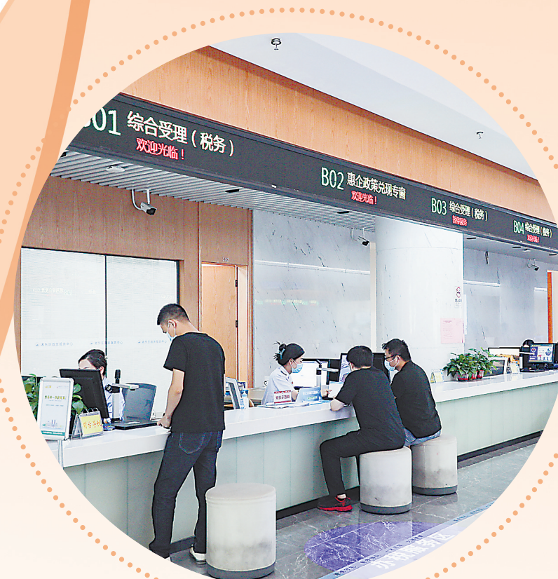
萍乡市湘东区政务服务中心窗口，工作人员正在为企业办理相关业务。

以数字经济大发展锻造“硬实力”，以营商环境大提升营造“软环境”，双“一号工程”正推动江西高质量发展跨越式发展迈向新境界。