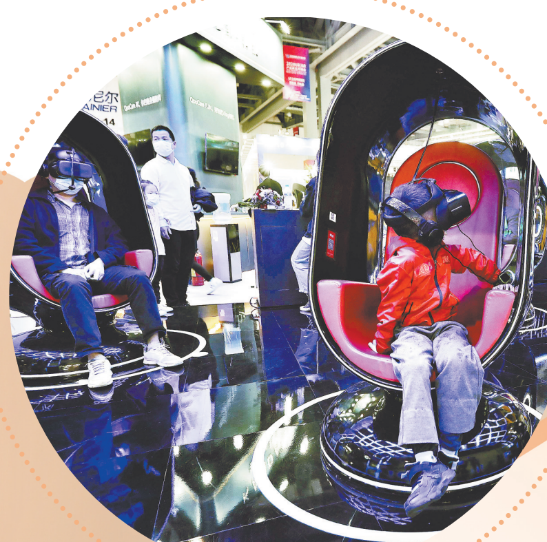
南昌绿地国际博览中心，市民在体验VR观影。