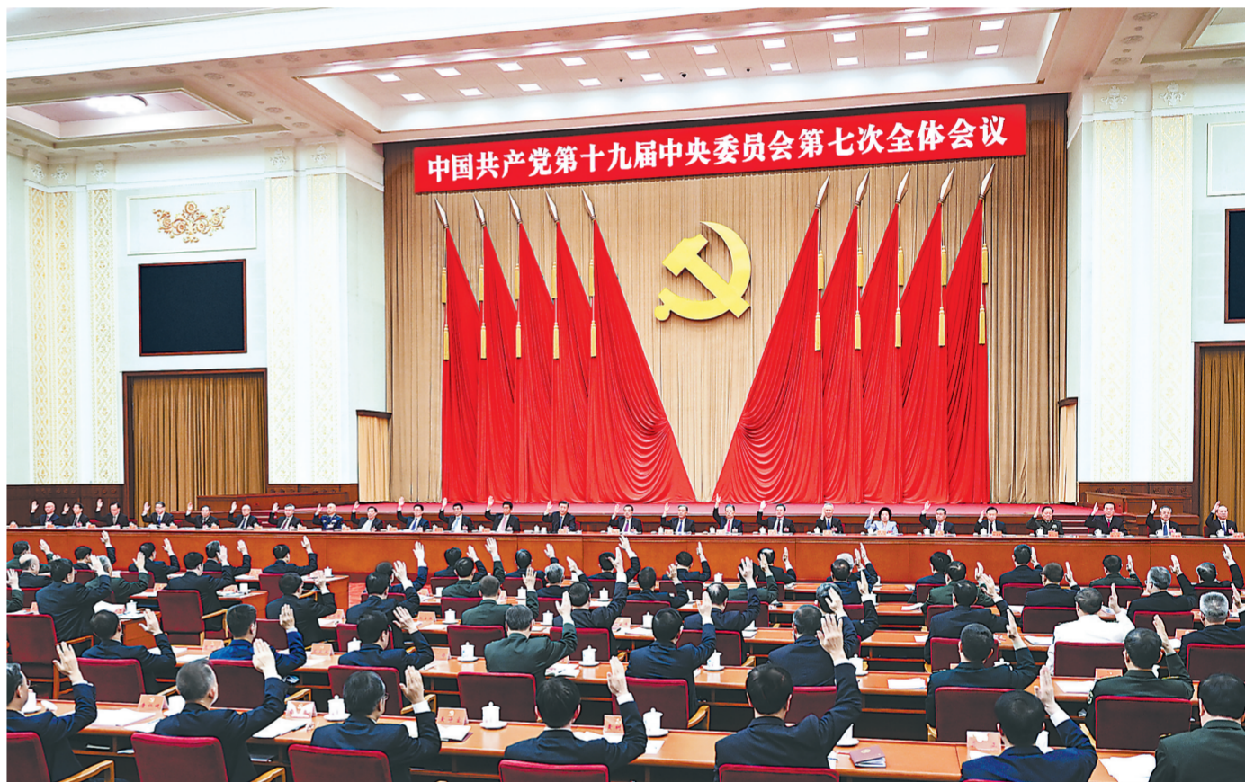
中国共产党第十九届中央委员会第七次全体会议,于2022年10月9日至12日在北京举行。中央政治局主持会议。