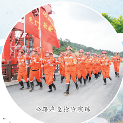
公路应急抢险演练

2021年，宜春市公路事业发展中心被省交通运输厅表彰为“全省‘十三五’国省干线公路养护管理工作先进单位”。今年，宜春市公路事业发展中心在省综合交通中心2021年度高质量发展考核综合评价中排名第一，还被评为“2021年度全省普通国省干线公路工作先进单位”。