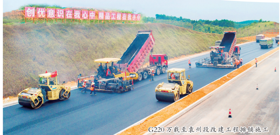
G220万载至袁州段改建工程摊铺施工

党建和业务相融互促，宜春公路系统全面打造“精品工程、示范工程、平安工程、廉洁工程”，助推全市公路事业高质量发展，让“宜路行”党建品牌真正立得起、叫得响。