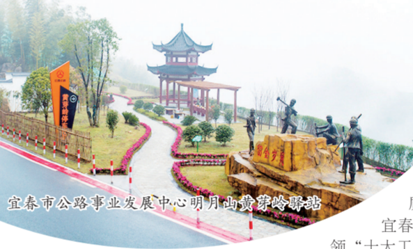
宜春市公路事业发展中心明月山黄岗岭驿站