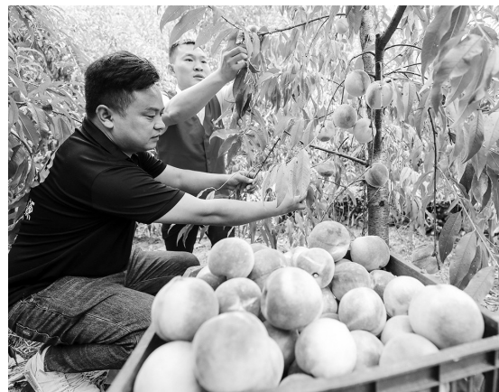
近年来,九江银行萍乡分行切实强化普惠金融支持萍乡山区村民发展特色农业。图为该行党员志愿者到芦溪县新泉乡陈家坊村帮助贷款村民采摘销售水蜜桃。

江西佳禾电声科技有限公司作为桐木镇引进的一家上市公司,从见面洽谈到签约落户仅用了一个月时间。项目签约后,该镇以最短时间、最高效率,为企业办理各项相关手续,确保项目快速实施,仅用一个月时间实现了该项目从签约到正式投产,并在15日内帮助企业招工2300余人。企业投产首月产值超400万元,去年全年产值达10亿元,目前正在建设的佳禾产业园1-5#厂房全部封顶,即将交付装修。(曾繁禧)