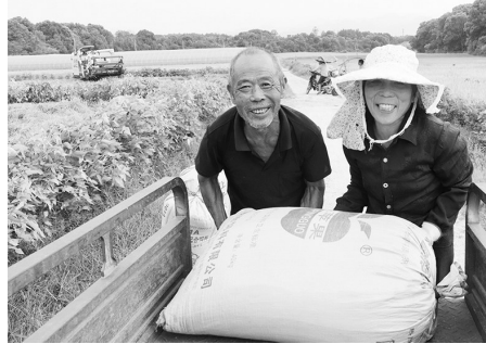
金秋时节,芦溪县源南乡的9000亩高标准农田喜获丰收。图为农户将装袋的稻谷搬上运输车。

如今,江口村村民纷纷报名参加艺术区的免费美术课程,江口小学的孩子也在下午4点半课堂迎来零799艺术区老师的公益课堂。(梁永明 刘武明)