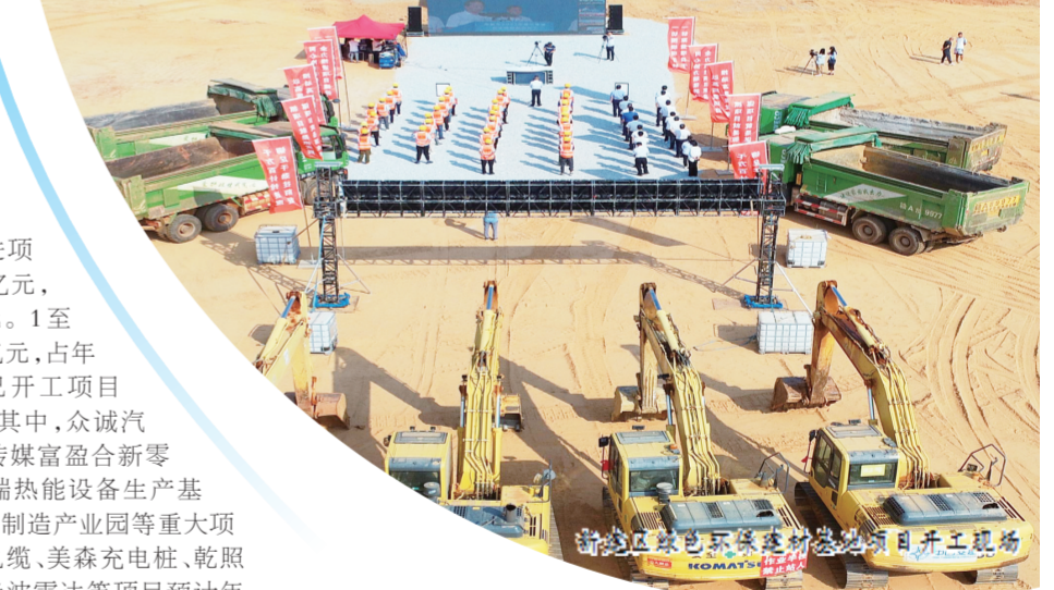
新建区绿色环保建材基地项目开工现场