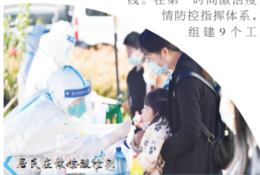
居民在做核酸检测

作专班,成立37个社区(村)分指挥部,区领导全程挂帅,7000余名机关干部、1500余名医护人员、1800余名志愿者、560余名教育工作者、1000余名公安干警、350余名民兵预备役人员下沉一线、驻守前线,涌现出了一大批最美“逆行者”“坚守者”“奉献者”,构筑起专业防控和群防群控的严密体系。