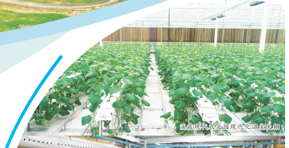
发展现代农业园现代化温室大棚

民发放基本生活物资、爱心礼包,尽力满足群众生活需求;在确保防疫安全的情况下,开放4家医院、组建19支社区巡回医疗服务队和隔离留观点专家医疗团队,为群众提供诊疗服务,全力保障群众就医畅通;通过开设诉求热线、民意邮箱和网络服务平台等,全天候受理群众诉求,以网格为单位全面收集办结各类群众诉求2万余件。此外,为激发新建人民的信心,推出一封信、一首歌、一首诗,向社会各界展示了新建自信自强的面貌。