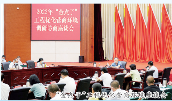
2022年“金点子”工程优化营商环境调研协商座谈会

下一步，新余将聚焦“作示范、勇争先”目标要求，全力扶产业促增长，为全面建设“六个江西”作出新贡献；聚焦“2+4+N”产业体系，按照“高大上、链群配”的思路，着力畅通产业循环，强化科技创新驱动，推进产业提能升级；健全项目建设“一条龙”服务协调机制，全流程安排专人协助帮办；同时，持续推进“放管服”改革，打响“贴新办”等政务服务品牌，为建设新型工业强市注入强大动能。