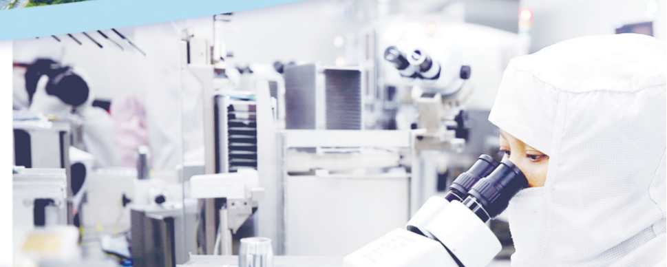
江西赣泰精密光学的员工在检验摄像模组合格样