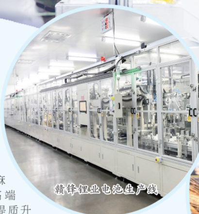
赣锋锂电池生产线

数字赋能，产业发展强劲。去年，新余制造业、战略性新兴产业、高新技术产业增加值占规上工业增加值比重，分别提高到94.1%、20.8%和24.5%。