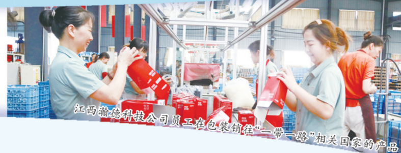
江西赣泰精密光学公司员工在包装销往“一带一路”相关国家的产品