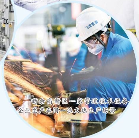
新余高新区一家管道技术设备企业生产车间一派火热生产场景