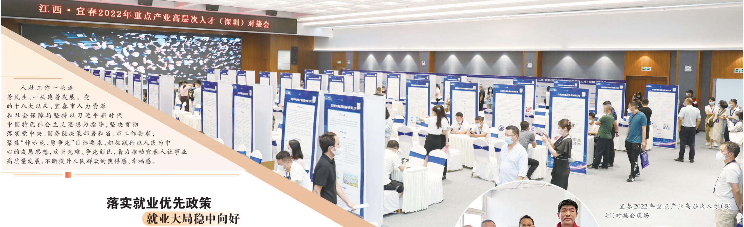
江西·宜春2022年重点产业高层次人才(深圳)对接会

人社工作一头连着民生，一头连着发展。党的十八大以来，宜春市人力资源和社会保障局坚持以习近平新时代中国特色社会主义思想为指导，坚决贯彻落实党中央、国务院决策部署和省、市工作要求，聚焦“作示范、勇争先”目标要求，积极践行以人民为中心的发展思想，攻坚克难、争先创优，着力推动宜春人社事业高质量发展，不断提升人民群众的获得感、幸福感。