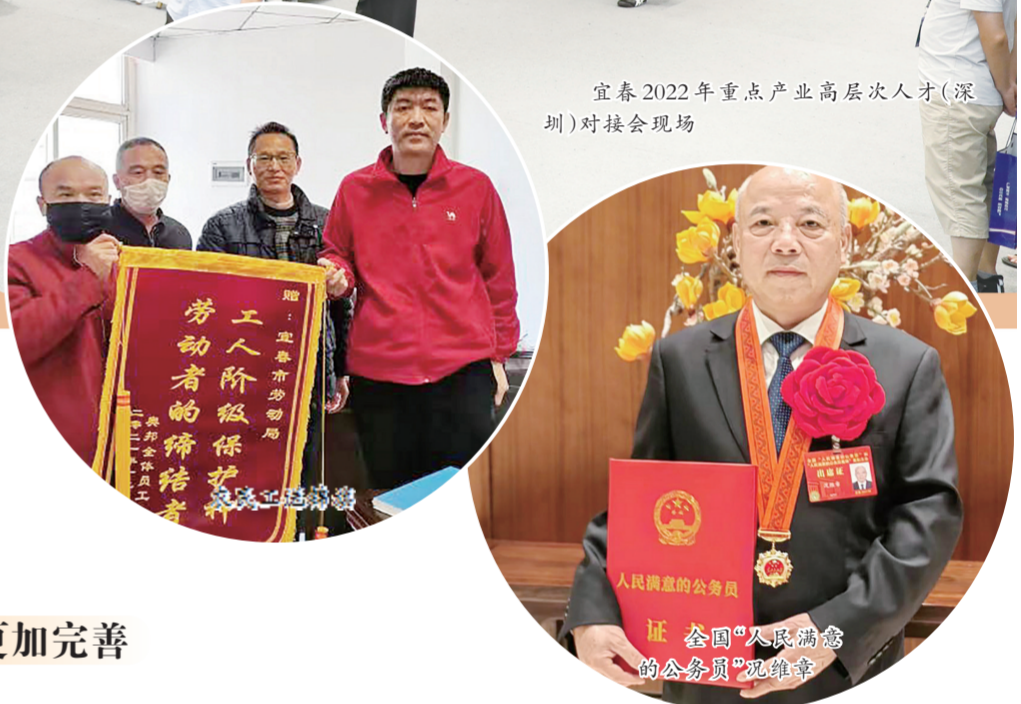
宜春2022年重点产业高层次人才(深圳)对接会现场

家，累计发放创业担保贷款189.31亿元。重点群体就业保持稳定。创新线上线下“15分钟公共就业服务圈”、高校毕业生“三深三合”等服务模式，统筹做好高校毕业生、农民工等重点群体就业工作，农村劳动力转移就业规模稳定在100万人以上，7.8万名脱贫劳动力实现就业，零就业家庭保持动态清零。