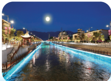
夜色下的“一河两岸”