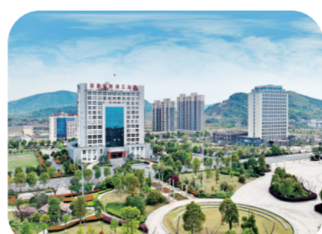
柴桑区赤湖工业园