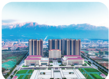
投入使用的民生工程“两场两中心”