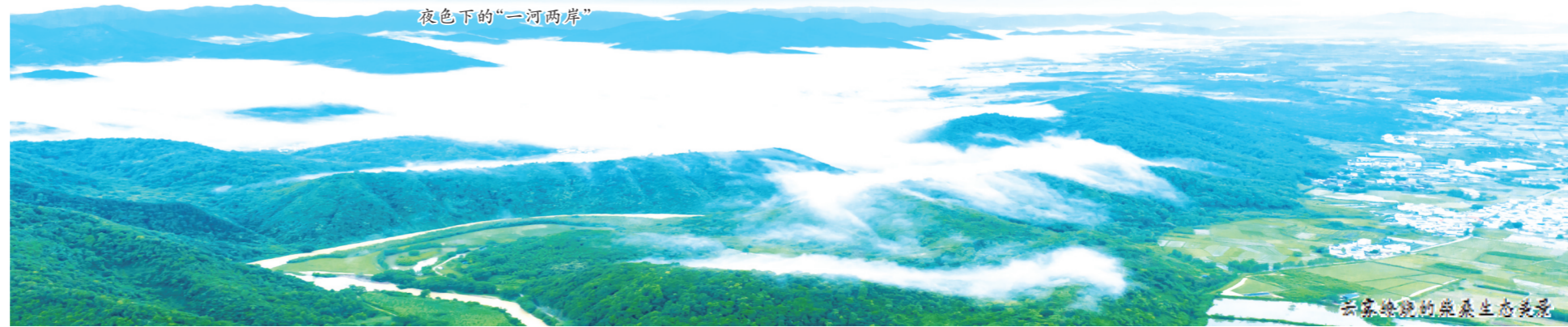
云蒸霞蔚的柴桑生态美景