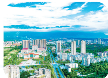
柴桑区城市美如画