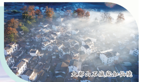
大鄣山石墙宛如仙境

全方位推动文旅融合。“宜融则融、能融尽融,以文促旅、以旅彰文”是婺源坚持推动文旅融合的工作思路。找准文旅的最大公约数、最佳连接点,推动文旅多方位、全链条深度融合,大力推动婺源茶艺、歙砚制作、徽剧表演等一批优秀民间文化艺术进景区,让游客们“零距离”、面对面地体验非遗瑰宝。