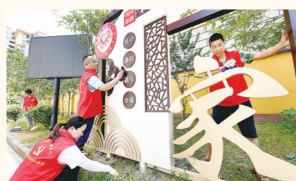
新营街道党员“一叫就到”服务队队员正在整治社区环境

十年来，德兴始终践行绿水青山就是金山银山发展理念，以创新驱动引领绿色低碳高质量发展，持续提升经济发展含金量、含新量、含绿量，先后获评中国绿色发