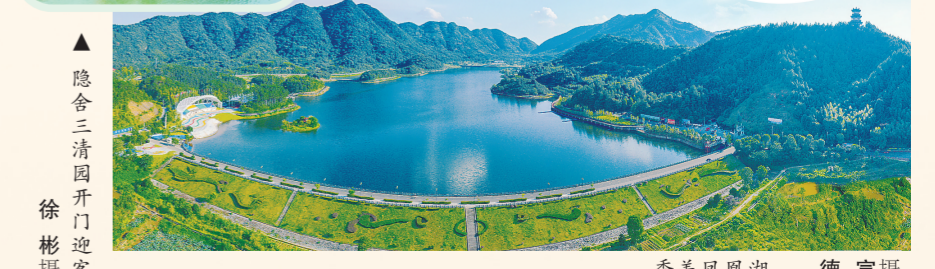
隐舍三清园开门迎客