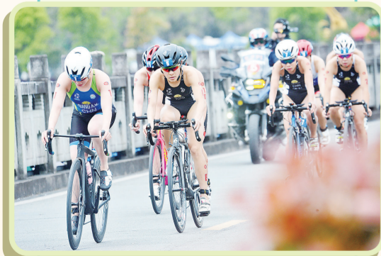
连续四年成功举办中国“铁人三项”联赛

——居民收入大幅增加。十年间，居民人均可支配收入快速增长，城镇居民和农村居民人均可支配收入分别由2013年的2.23万元、0.96万元提高到4.21万元、1.98万元，年均分别增长8.3%、9.5%，经济的持续健康发展让居民腰包鼓了起来。