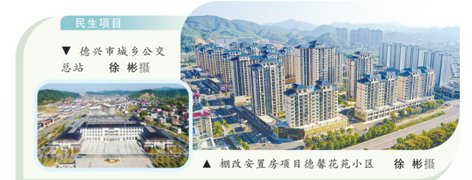
民生项目 德兴市城乡公交总站

十年来，德兴强力推进“平安德兴”建设，让群众安全感更加充实、更有保障、更可持续。坚持精准施策，深入开展扫黑除恶专项斗争，深入推进“全民反诈”，加强立体化、智能化社会治安防控体系建设，“智慧小区”建设经验在上饶市全面推广，市公安局获评全国优秀公安局。始终坚持源头治理，深化“枫桥经验”德兴实践，投资1亿多元建设集信访调处、纠纷调解、应急指挥等于一体的市乡两级社会治理中心，创新打造“红色物业联盟”，打通城乡基层治理“最后一米”。