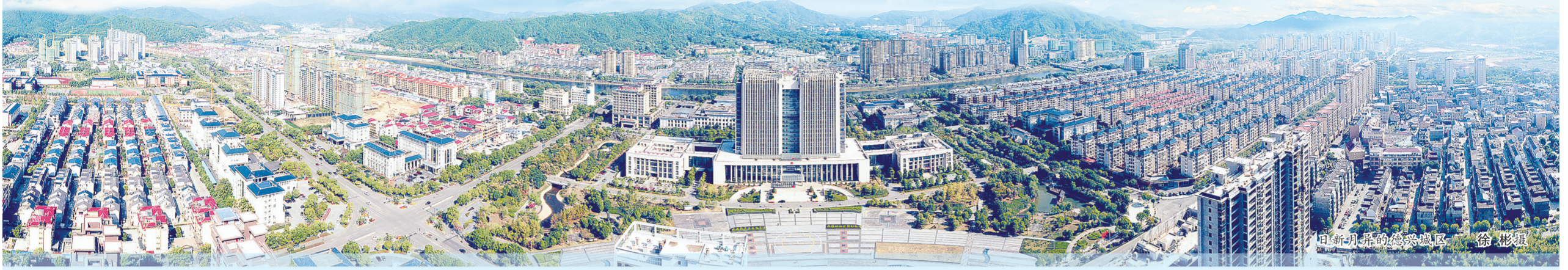
日新月异的德兴城区

胜日寻芳泗水滨，无边光景一时新。德兴高新技术产业园区，数字化车间机器轰鸣，一件件德兴“智造”走下生产线；中心城区，建设工地塔吊林立，一个个民生项目建成投用；巍巍大茅山、秀美凤凰湖游人如织、尽享秋韵……如今，在2101平方公里的铜都大地，项目落地开花，城市日新月异，人民安居乐业。