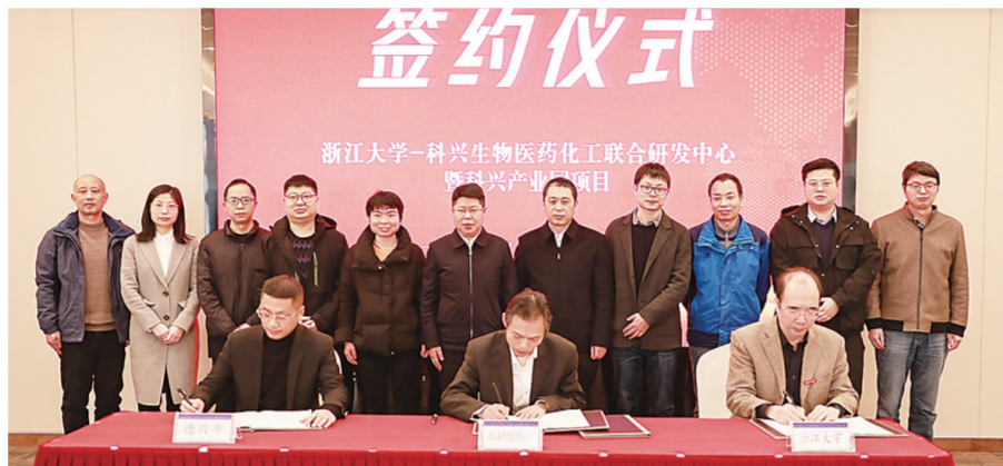
投资106亿元的浙江大学-科兴产业园项目落户德兴