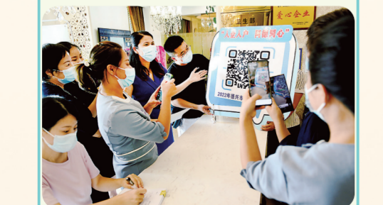
德兴市委统战部干部职工入企服务