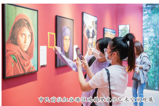
市民参观在红谷滩区举办的文化艺术节