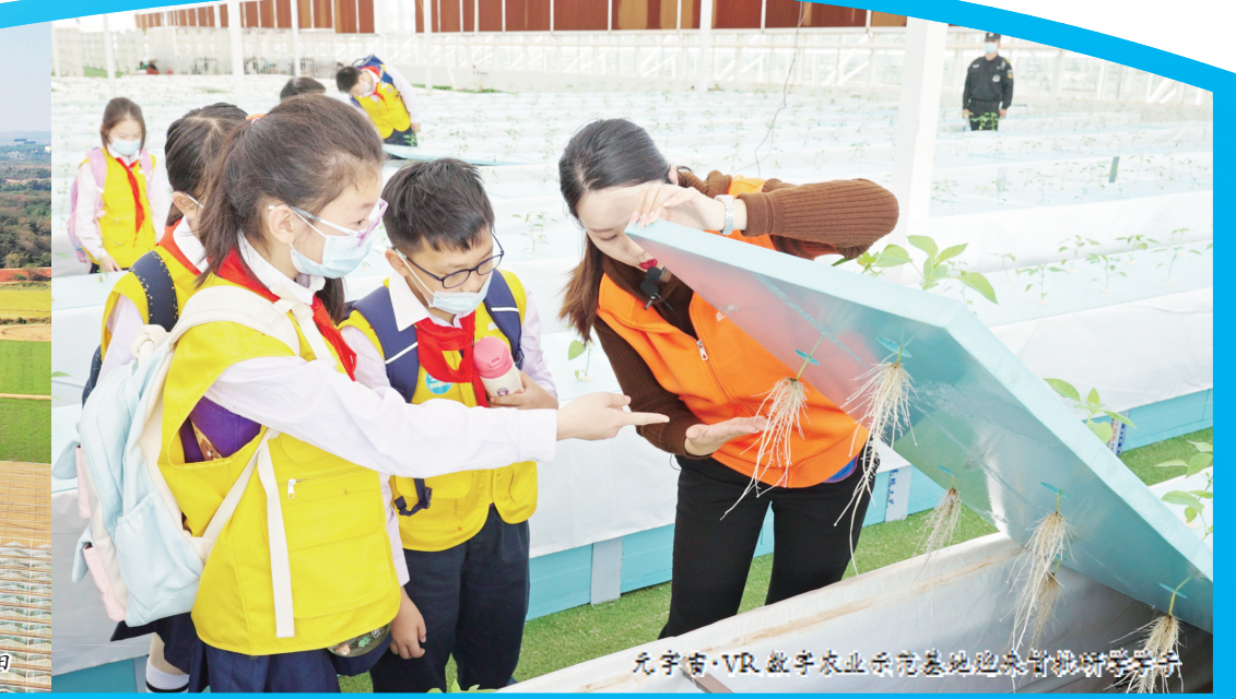
元宇宙·VR数字农业示范基地元宇宙研学活动