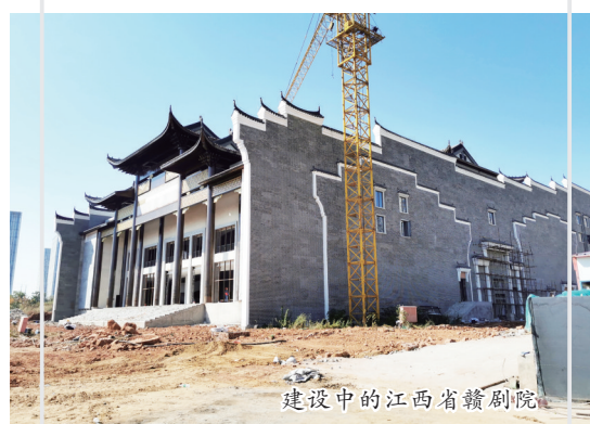
建设中的江西省赣剧院