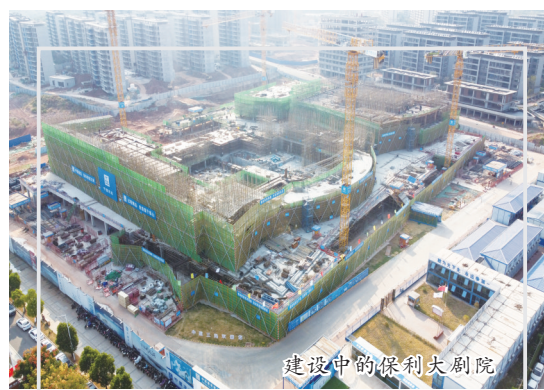
建设中的保利大剧院

除了VR产业的欣欣向荣，红谷滩区的现代金融服务业同样令人瞩目。十年来，红谷滩区金融商务区完成了从3家金融机构到各类金融机构和金融服务企业1264家的跨越，实现了从弱到强的质变，全省80%以上的法人金融机构和省级区域性总部汇聚于此，产业集聚规模和等级均得到有效提升，全产业链金融服务业格局加速成形，金牌照、多层次的区域金融服务体系日趋成熟，区域金融中心核心承载区基本建成。