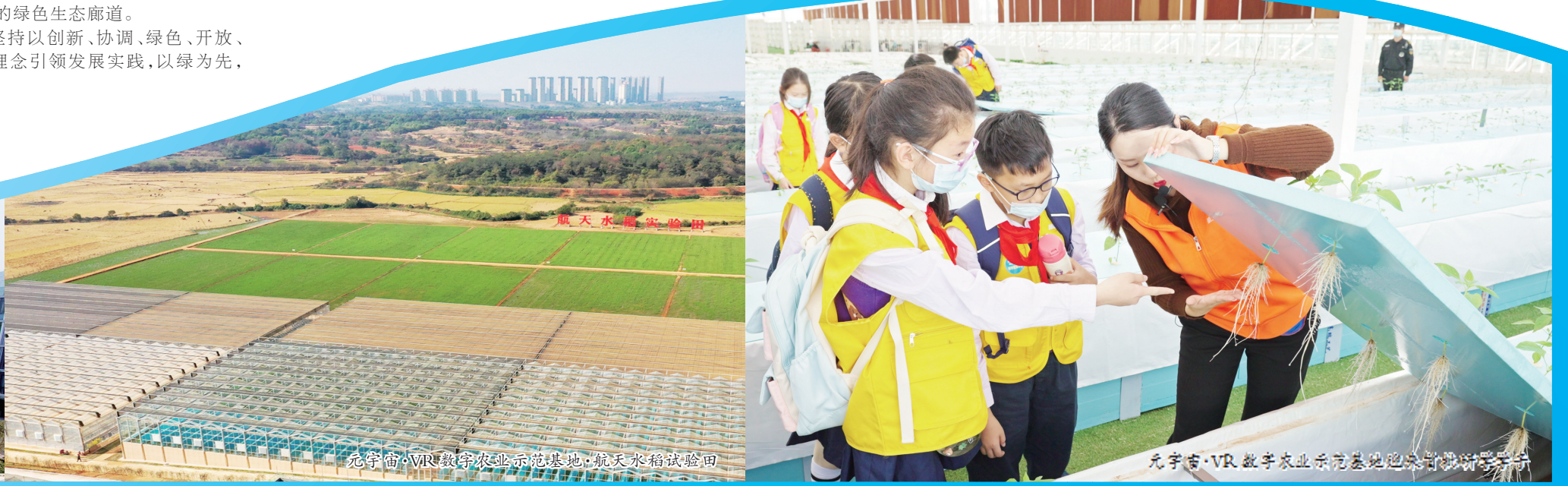
红谷滩区VR数字农业示范基地

如今的红谷滩区，金融大楼鳞次栉比，“双子塔”拔地而起，VR科创城科技感十足，秋水广场音乐悠扬，商贸街区人流如织，好一座宜居宜业的现代化新城。