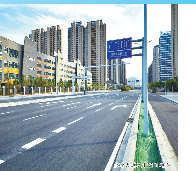
圭峰大道9月22日通车

“断头路”的打通，就是红谷滩区为群众办理的众多实事中的一件。今年以来，红谷滩区打通“断头路”项目的好消息频频传来——江报路(飞虹路—庐山大道)9月6日通车，石钟山路9月7日主路通车，赣江北大道下穿京九铁路通道9月19日通车，圭峰大道九江街至梧桐街段9月22日通车；龙兴大街“网红桥”路段双向主路10月1日通车；花园南路将于11月底实现主路通车……“断头路”打通后，周边交通循环得以