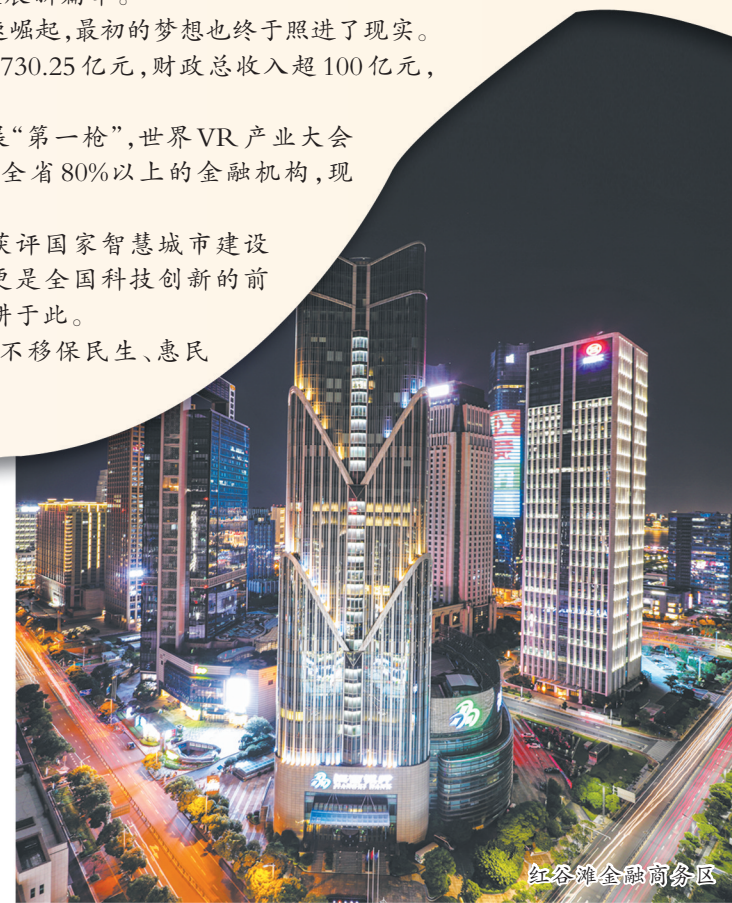
红谷滩金融商务区

奋力追梦的红谷滩区，将继续做新时代的“追梦人”，围绕“全省示范领先、中部比肩赶超、全国进位争先”的目标，继续保持领先领跑姿态，全力打造高端产业集聚区、省会形象展示区、改革创新引领区、扩大开放示范区、优质功能承载区、幸福生活优享区。