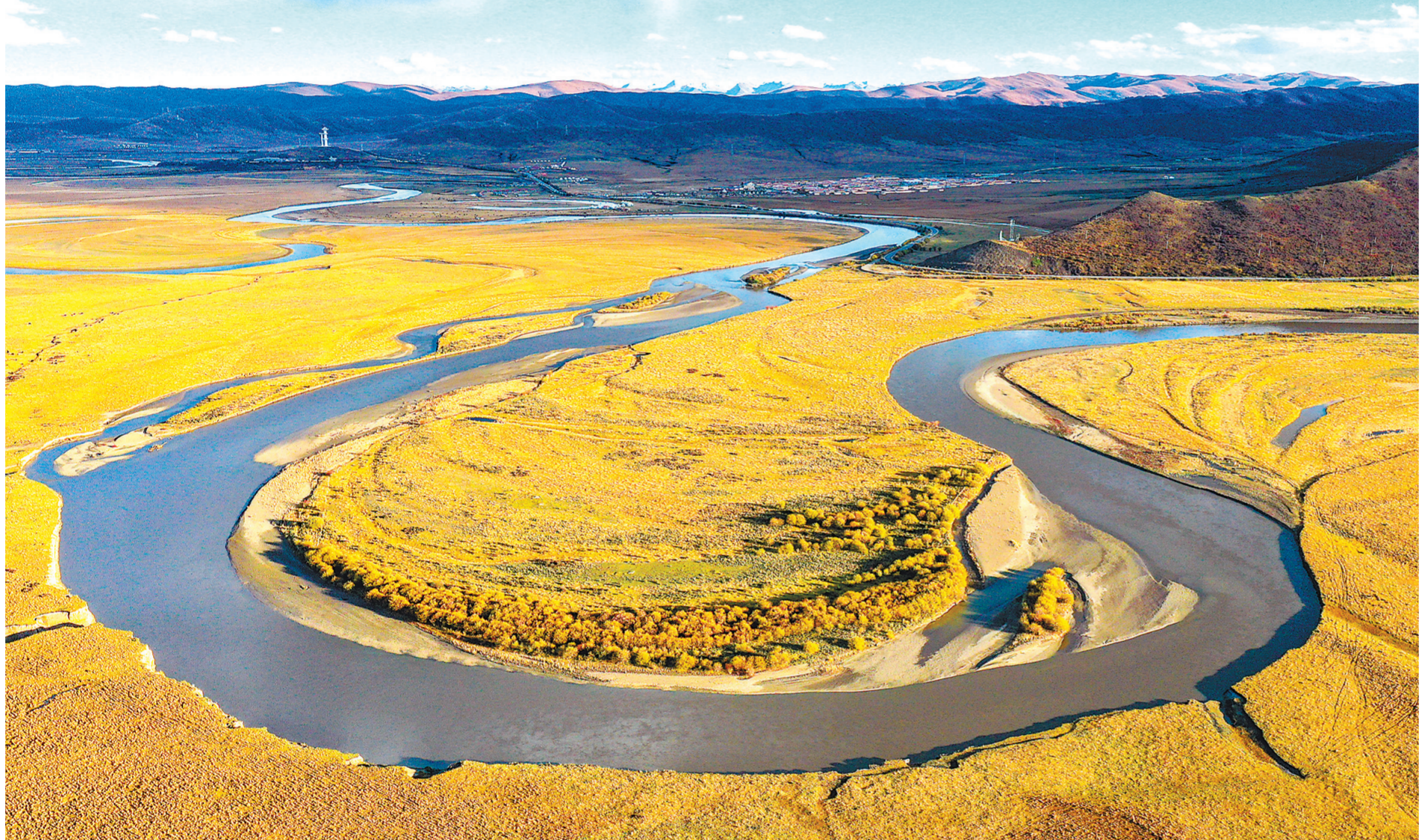
这是10月20日在四川省阿坝藏族羌族自治州红原县拍摄的月亮湾湿地景色(无人机照片)。

此外，发来贺电贺函的还有毛里求斯社会主义战斗运动主席莱斯琼加德，巴西社会民主党主席阿罗若，塞拉利昂人民党总书记科罗马等。