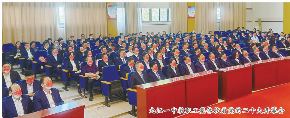
九江一中教职工集体收看党的二十大开幕会

党旗领航，队伍前行。进入新时代以来，学校以强化“三支队伍”建设为抓手，有力地推动了学校高质量发展。一是以示范引领为主线，旗帜鲜明抓好党员队伍建设。学校党委加强基层党组织建设，把支部建在年级部上，通过开展“不忘初心、牢记使命”主题教育和党史学习教育，强化党员的教育管理，加强党风廉政建设，充分发挥党员干部在教育、疫情防疫、文明创建、脱贫攻坚、乡村振兴等工作中的先锋模范作用，学校多次获得“先进基层党组织”。二是以忠诚担当为核心，毫不动摇地抓好干部队伍建设。学校持续强化干部教育管理，经常性地开展政治理论学习和业务培训，不断提升干部的政治素养和业务能力，时刻把纪律规矩挺在前面，严格落实