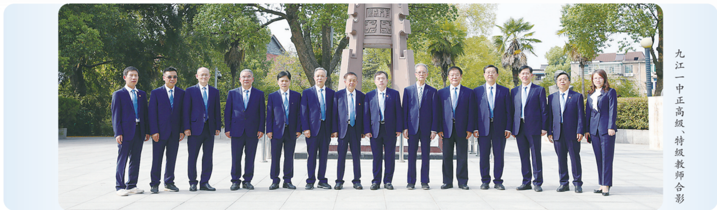
九江一中正高级、特级教师合影