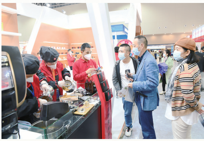
各地客商云集樟树药交会展会现场

货真价实的道地药材、琳琅满目的大健康产品、智能高端的中医药器械……走进樟树市岐黄小镇会展中心，一排排国际标准展位高端大气，前来询价购物、洽谈业务的客商代表、市民群众络绎不绝，一派热闹的交易景象。