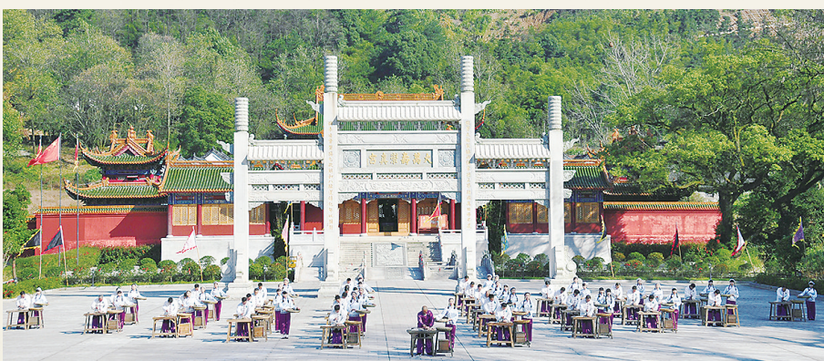
樟帮中药炮制技艺展演