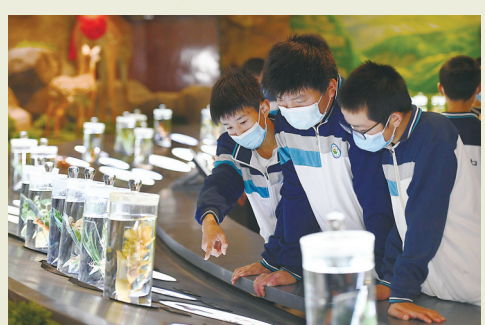
中小学生在樟树中医药博物馆参观