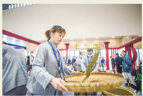
樟帮中药炮制技艺展演