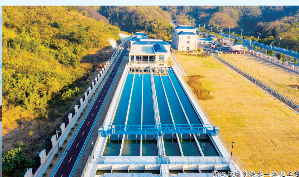
湖口县污水处理厂