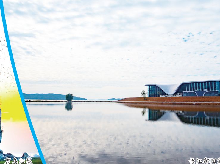
长江和鄱阳湖生态保护区