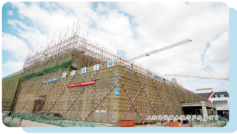
江咨咨询服务数智产业园项目

惟改革者进,惟创新者强,惟改革创新者胜。国资国企改革三年行动开展以来,江咨集团始终坚持和加强党的全面领导,以战略化协