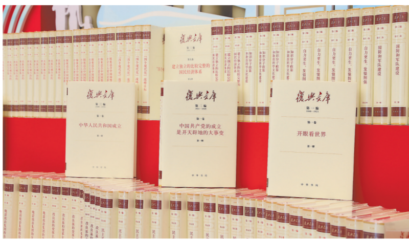
这是大型历史文献丛书《复兴文库》。

述先人的开拓,启迪后来的奋斗。皇皇巨制,既致敬一代代人志士追寻复兴的百年求索,更激励中华儿女踔厉奋发、勇毅前行,为全面推进中华民族伟大复兴而团结奋斗。