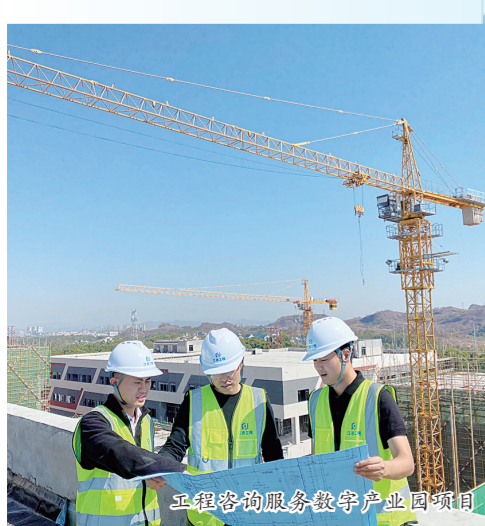
江咨咨询服务数智产业园项目

赓续红色血脉,凝聚奋进伟力。作为一家人力资源型、知识密集型现代服务业国有企业,江咨集团由原江西省机械设备成套局改制成立,先后经历公司制改制、股权多元化改革和混合所有制改革三次改革,现已发展成为江西省工程咨询行业中资质齐全、技术实力雄厚、广泛覆盖各类行业的一家综合性工程咨询服务机构。该集团下辖18家子公司、参股6家公司、管理4家设计院,主要从事招标代理、融资租赁、工程咨询三大板块业务。肩负行业“领跑者和推动者”的使命,江咨集团始终坚持以高质量党建引领企业高质量发展,以改革创新不断焕发企业活力,稳居全国招标咨询服务机构“第一方阵”。