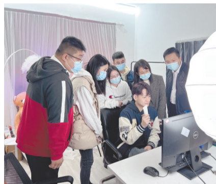
学员们在学习直播技巧。