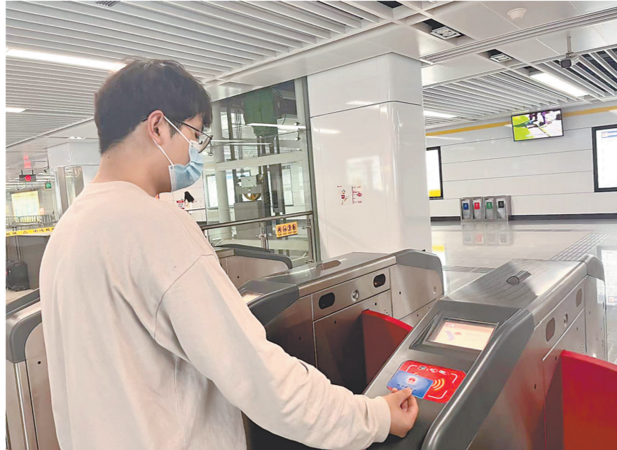
南昌市民可持三代社会保障卡乘坐地铁公交。

社会保障卡,百姓几乎人手一张,平时看病买药、领退休金,都离不开它。2012年,我省发行了加载金融功能的二代社会保障卡,开始全面推进社会保障卡“一卡通”建设。去年,我省第三代社会保障卡于都县首发。一张小小的卡片,承载的功能愈发强大。截至今年10月底,全省累计制发实体社会保障卡4789万张,签发电子社会保障卡2847万张,基本形成了“城市十分钟,农村半小时”社保服务圈,初步实现了财政、医疗、民政、文化、交通等领域的“一卡通”。