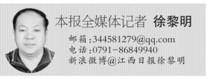
本报全媒体记者 徐黎明

邮箱:344581279@qq.com 电话:0791-86849940 新浪微博@江西日报徐黎明