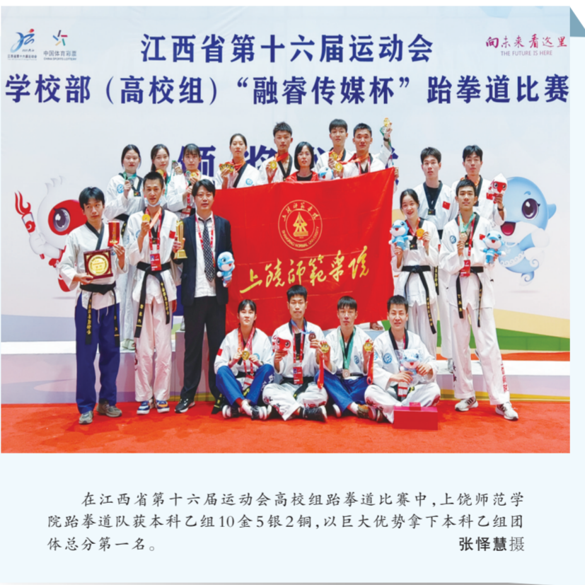
在江西省第十六届运动会高校组跆拳道比赛中，上饶师范学院跆拳道队获本科乙组10金5银2铜，以巨大优势拿下本科乙组团体总分第一名。

该乡以促进义务教育优质均衡发展为抓手，着力改善乡村教育办学条件，努力实现城乡学校“办学条件一样好，教育装备一样全，校园环境一样美”。目前，该乡已投入120万元推进复礼中学房屋改造项目，完成渭下村中心幼儿园选址征地工作，闪石中心幼儿园建设项目即将竣工。同时，该乡加强学生精准资助管理，形成覆盖幼、小、初、高、职的资助体系，2022年全乡共资助学生789人，总金额达58.3125万元。（刘啸林）