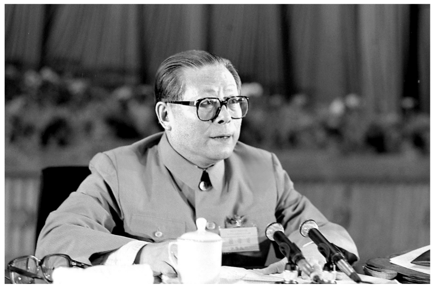
上图:1989年6月23日至24日,中国共产党第十三届中央委员会第四次全体会议在北京召开。这是江泽民同志在会上讲话。