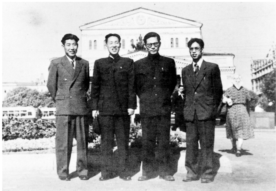
上图:1955年至1956年,江泽民同志(右二)曾在莫斯科斯大林汽车制造厂实习。这是江泽民等在莫斯科合影。