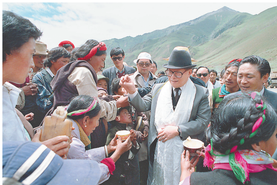
上图:1990年7月25日,江泽民同志与藏族群众共庆望果节。