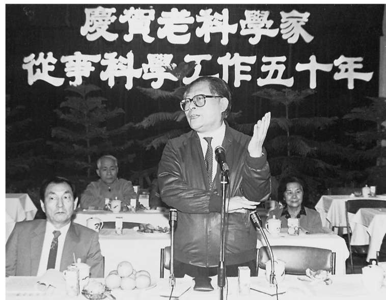
上图:1988年10月,江泽民同志在上海庆贺老科学家从事科学工作五十年座谈会上讲话。