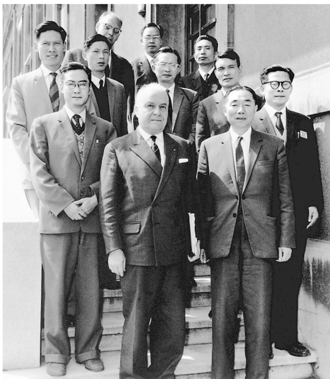
右图:1964年6月,江泽民同志(二排右一)在法国艾克斯莱班出席国际电工委员会会议期间与会代表合影。