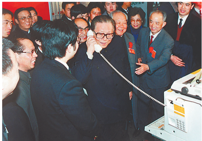
上图:1984年5月,江泽民同志在北京展览馆举行的全国电子新产品展览会上,试用国际长途电话向远方的工作人员问候。