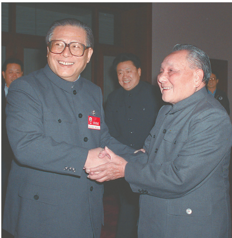
右图:1989年11月6日至9日,中国共产党第十三届中央委员会第五次全体会议在北京召开。这是邓小平同志和江泽民同志亲切握手。