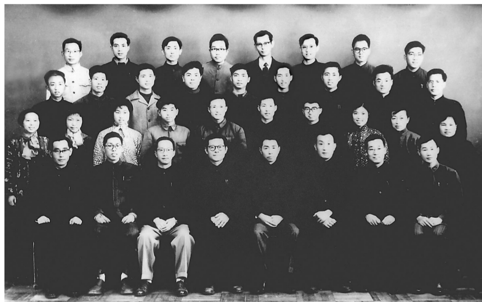
上图:1963年3月,江泽民同志(前排右五)在上海同小型三相异步电机全国统一系列设计领导小组成员合影。