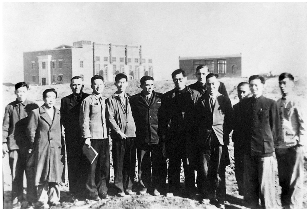
上图:1956年,江泽民同志(左七)在长春第一汽车制造厂同援建一汽的苏联专家等合影。