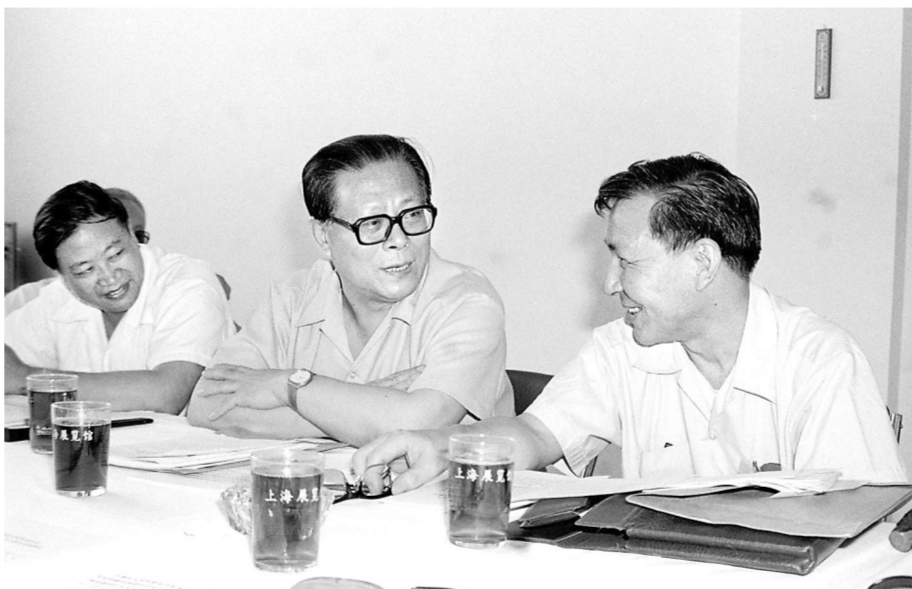
上图:1985年,江泽民同志在上海市八届人大四次会议上。