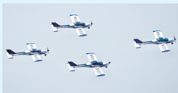
山河表演队飞行表演