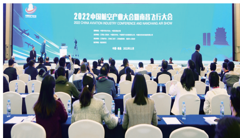
中国航空产业大会