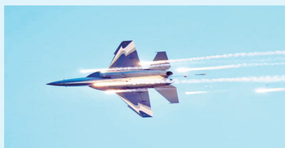
“猎鹰”L-15教练机飞行展示