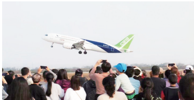
国产大飞机C919飞行展示