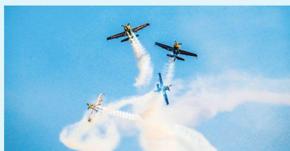
南非飞行家表演队