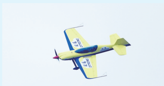
俄罗斯极限表演队