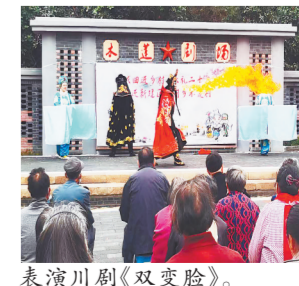
表演川剧《双变脸》。

通讯员樊燕星)“这些戏曲节目,我们很喜欢。”近日,南昌市新建区铁河乡木莲村村民向江西新闻客户端“党报帮你办”频道反映,当天,由农工党新建区总支联合农工党南昌市委歌舞团支部、采茶剧团支部及南昌市文化艺术中心开展“戏曲进乡村”文化帮扶活动,让村民享受到了一场文化盛宴。当南昌采茶戏《绣房会》、川剧《双变脸》和歌曲演唱等形式