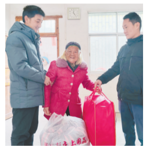
把御寒物资送到群众手中。

本报讯(全媒体记者洪怀峰 通讯员华辛明)近日,会昌县清溪乡清溪村低保户古海洲向江西新闻客户端“党报帮你办”反映,在清溪乡党委、政府的帮扶下,他拿到了毛毯、棉被等物资,御寒多了一份保障。据悉,为防范低温冰冻天气对群众生产生活带来不利影响,清溪乡提前做好应急预案,对辖区在建工程、饭店、敬老院等重点场所开展排查,全力保障群众的生命和财产安全。同时,组织干部对全乡120户低保户、生活