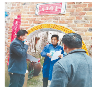
劝导员向居民发出倡议书。

本报讯(侯艺松 通讯员杜必玉)近日,吉安桐坪镇枫冈村一对新人举行了一场别具一格的婚礼,只宴请了少数亲朋好友,场面虽然简朴,却办得很热闹。据了解,桐坪镇日前成立了移风易俗工作领导小组,组织街道召开专题会议,以村为单位,由乡贤、老党员作为“劝导员”向居民发出倡议书,倡导健康文明、简约适度的婚俗礼仪,在特殊时期婚事新办、喜事缓办、简化结婚办理流程。该工作小组还牵头成立