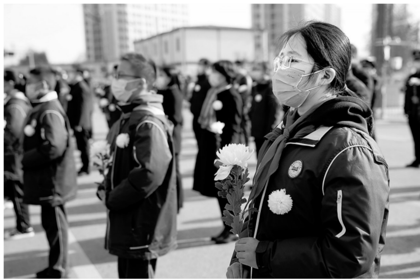
12月13日，人们在侵华日军南京大屠杀中山码头遇难同胞纪念馆前悼念。

2014年2月27日，十二届全国人大常委会第七次会议通过决定，以立法形式将12月13日设立为南京大屠杀死难者国家公祭日。