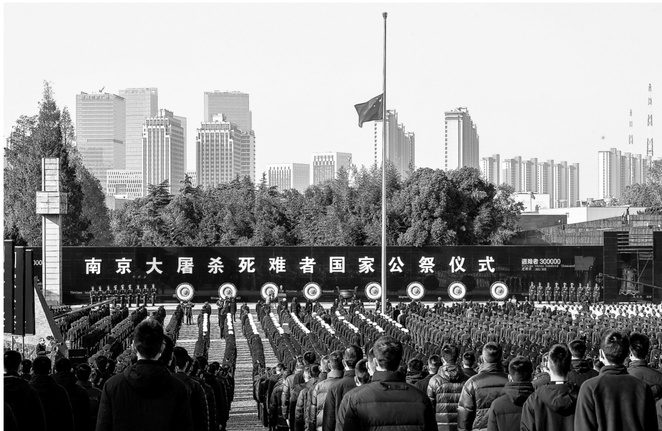
这是12月13日拍摄的南京大屠杀死难者国家公祭仪式现场。

蔡奇讲话后，85名南京市青少年代表宣读《和平宣言》，6名社会各界代表撞响“和平大钟”。伴随着3声深沉的钟声，