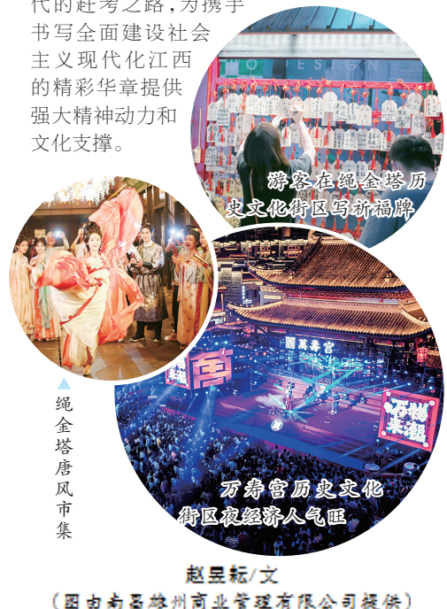
赵昱耘/文

网红打卡地、市民休闲地“五地”目标,走好新时代的赶考之路,为携手书写全面建设社会主义现代化江西的精彩华章提供强大精神动力和文化支撑。