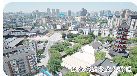
绳金塔历史文化街区