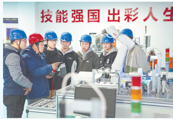
在江西制造职业技术学院智能制造协同创新中心，老师带领学生进行工业机器人实操训练。

征程万里风正劲，重任千钧再出发。当前，全省教育系统聚焦学前教育“补短板”，义务教育“重均衡”，职业教育“扬优势”，高等教育“求突围”，全面落实“十四五”教育发展规划和教育高质量发展实施方案，大力实施学前教育发展提升行动计划、义务教育薄弱环节改善与能力提升工程、县域普通高中发展提升行动计划等九大行动，办好人民满意的教育。深入实施国家级科技创新平台培育计划，推进有组织科研，紧扣“2+6+N”产业和省级重点产业链高质量发展，集中力量进行原创性引领性科技攻关。扎实推进全省教育人才队伍建设三年行动计划，努力构建“培育—引进—稳定—激励”四位一体的人才队伍建设新机制。发挥高校培养创新人才主力军作用，努力培养造就更多能够支撑“六个江西”建设的大师、战略科学家、一流科技领军人才和创新团队、青年科技人才、卓越工程师、大国工匠、高技能人才。实施红色文化育人工程，奋力打造红色基因传承的“样板高地”。积极发展素质教育，健全家校社协同育人机制，促进学生全面发展，为全面建设社会主义现代化江西作出更大的贡献。