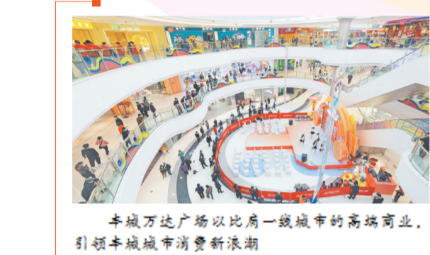
丰城万达广场以比肩一线城市的高端商业，引领丰城市消费新浪潮

翻看2022的时光画卷，一幅提质增效、行稳致远的高质量发展图景正精彩呈现。 这里演绎着戮力同心的跨越：GDP预计突破700亿元，财政总收入突破100亿元，宜春丰城高新区产值预计突破1000亿元，全国百强县列第五十七位，较上年前进7位…… 这里展现着振奋信心的荣誉：连续获评全省高质量发展综合绩效考核先进县市、江西省“五型”政府建设示范县市和先进集体；荣获全省开放型经济工作综合先进单位，获批全省首批营商环境创新试点城市、全省首批碳达峰试点城市、全省首批社会治理现代化试点县市、连续十一年获评全国超级产粮大县…… 这是丰城市委、市政府带领百万丰城人民，踔厉奋发、勇毅前行，一步一个脚印扎实干出来的。