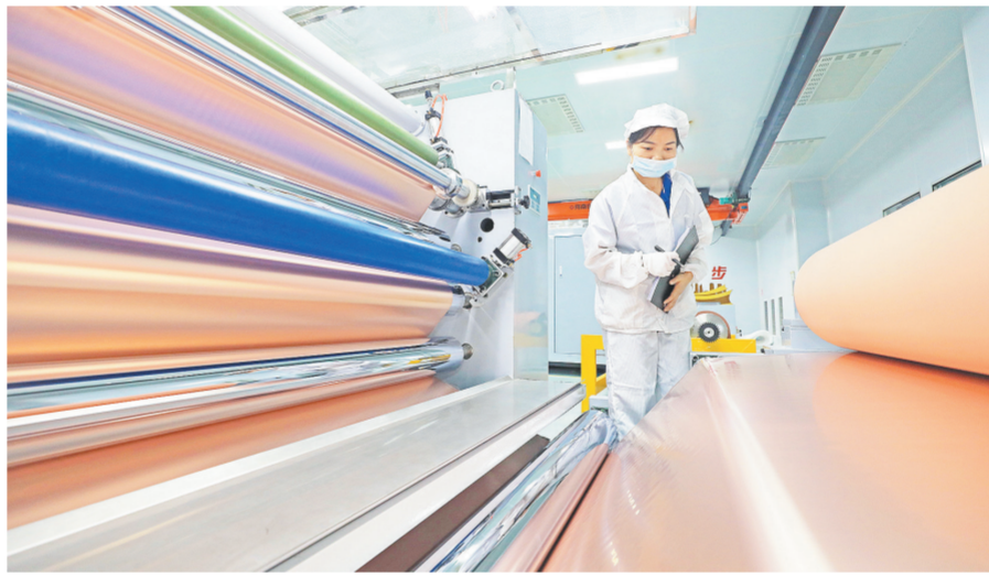
丰城市循环经济产业园江西麦得新材料有限公司员工在新投产的生产线上查看超薄电子级铝箔质量情况

项目攻坚蓄后劲。深入开展“开放提升、引强攻坚”大会战活动，围绕“高大上、链群配”要求，持续开展产业招商，赣锋锂业、九岭锂业、隆成电子、环耀智能、盛威国际等头部企业纷纷落户丰城，积蓄了发展后劲。加快推进项目建设，落实市领导挂点和部门乡镇牵头服务等机制，纳入宜春市第一批重大项目共82个，总投资715.86亿元，目前已全部开工，完成年计划投资的120.8%。 科技创新强动能。大力实施创新驱动战略，华伍制动获国家制造业单项冠军示范企业，正导精密获国家级专精特新“小巨人”企业，全市研发投入8.08亿元，较上年增加0.8%。成立南昌大学循环经济产业丰城研究院，华伍、格林美、春光等9家企业与华东交通大学、省科学院等9家大学、科研院所派出的科技特派员签订合作协议。