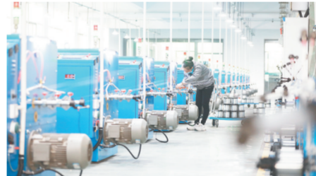
国家专精特新小巨人企业江西正导从签约落户到建成投产仅用了8个月时间，体现了“丰城速度”。因为该企业员工在生产线车间赶制订单

建设2022年7万亩高标准农田，总投资达2.1亿元。稳步推进现代农业示范区建设，新增固定观测点30个，完成核心试验区田间试验研究5组。改造提升3000亩富硒科研创新基地，成功申报2022年省富硒农业先行示范区和2023年省富硒功能农业重点县。 美丽乡村扎实推进。建设秀美乡村，退出宅基地461宗面积4.13万