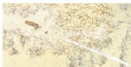
丰城市同田乡同田村千亩莲藕种植基地，村民正在采收莲藕