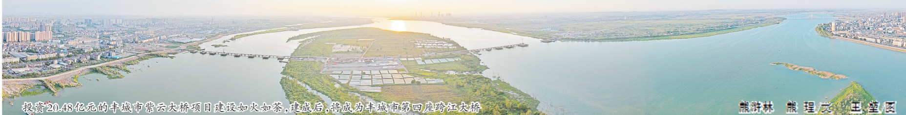
投资20.43亿元的丰城市紫云大桥项目建设如火如荼，建成后，将成为丰城市第四座跨江大桥

党建“三化”构建基层治理“两员两长”（网格指导员、专职网格员、楼栋长、单元长）做法获时任省委主要领导高度肯定；“红色治理共同体”建设获评全省十大“创新实践案例”，被中央政法委表扬推介；意识形态工作“三张清单”被中宣部肯定推介……一个个战斗堡垒和“红色先锋”，正汇聚起丰城经济社会发展的磅礴力量。 筑牢根基强堡垒。深入推进基层党建“三化”建设提质增效，整顿软弱涣散基层党组织9个，选树乡村振兴模范党组织13个。搭建“码”当先平台，完善村级便民服务平台607个，解决群众诉求30639个。成立“小个专”综合党委、市互联网行业党委、物流运输行业党委和物业行业党委，引导814户经济组织990名党员亮身份、作表率。 选人用人重实干。深入开展“三拼三促”工作，建立乡镇（街道）科级干部横排竖比、国有企业季度经营业绩“赛马”测评、市直部门创建“让党放心、人民满意”的模范机关等考核机制，运用书面提醒、集中办班、诫勉谈话、组织处理“四种形态”监管干部，激励党员干部担当作为、奋勇争先。 恪守勤廉葆本色。开展整治干部作风顽疾“五治”行动，持之以恒纠“四风”树新风，查处违反中央八项规定精神问题155起，处理184人，查处形式主义、官僚主义问题75起，处理108人。持续深化正风肃纪反腐，今年以来共立案434件，处分466人，勤廉丰城建设持续深化。巡村工作“四个一批”做法受到省委巡视办通报表扬。 砥砺前行正当时，勇毅前行向未来。敢想敢干、重情重义丰城人，正循着党的二十大擘画的宏伟蓝图，昂首阔步，奋力冲刺全国50强。