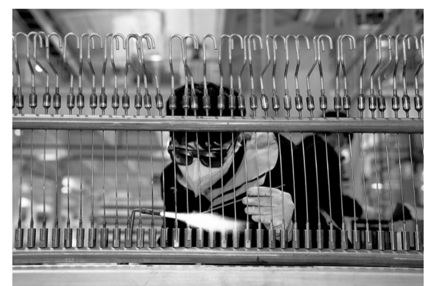
近日,在赣州市南康区格力电器(赣州)智能制造基地,工人正在进行毛细管焊接作业,车间内一派繁忙景象。据了解,该基地计划2023年全面投产,冲刺年产300万套空调、营业额超百亿元目标。