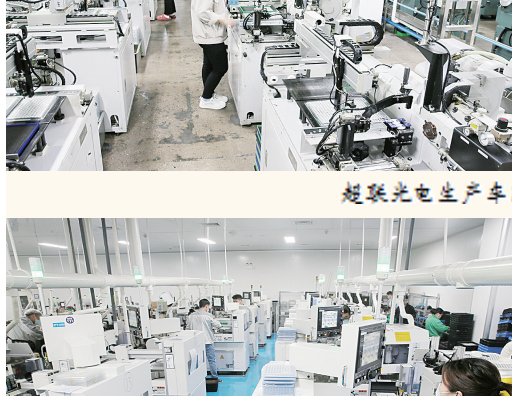
捷泰锂电生产车间