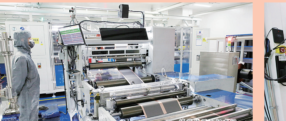
蜂巢能源锂电车间