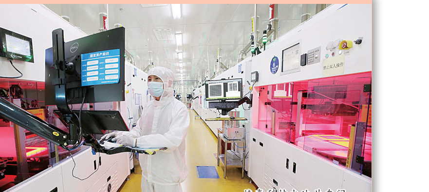
蜂巢能源锂电车间

这是一座现代新城。方圆207平方公里的土地上，大街繁华、高楼栉比，人群川流不息…… 这是一个工业重镇。道路四通八达，工厂热火朝天。兴业大道、创新大道、共享大道，条条道路连通产业；晶科、吉利、长城、蜂巢、凤凰，大厂名企扎根上饶。2022年，这里预计实现主营业务收入2000亿元。第一个千亿元，这里用了19年，第二个千亿元只用了两年，两年再造了一个经开区！ 2022年，“三新一高”是这里的主旋律，产城融合是这里的主战场。滨江商务中心墨彩纷呈，妙笔写锦绣，产城融合样板区、百里信江典范区呼之欲出、气势如虹。 这是江西工业重镇，是上饶新城，是城市与产业的交响，是产城融合的典范。上饶经开区的建设者，用善谋、实干、担当，描绘了经济开发区高质量发展的崭新画卷。