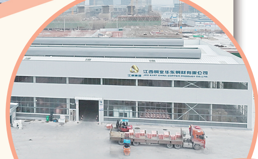
江铜集团铜杆铸造新材料项目

双向奔赴就是担当。2022年，上饶经开区开展各类“开拓市场万里行”活动48次，行程1045万公里，帮助企业签订订单金额287.9亿元，同比增长31%。上饶经开区帮蜂巢能源一起抢订单的故事，成为上饶工业发展史上的美谈。 高质量发展就是担当。2022年，上饶经开区企业R&D研发投入突破30亿元，是2019年的一倍，连续三年研发投入强度保持在4.4%左右，高于全国平均两个百分点。组建13支产业基金，投了13个项目，其中6.5个项目成功顺利退出，投了英雄，以实绩论英雄”的正确用人导向。推进片区企业综合服务改革，以片区化、网格化治理为抓手，将经开区划分为五大片区，每个片区划分为若干个网格，由各片区指挥部统筹协调，形成了一个网格、一个部门挂点、一名网格员、一名网格员、一套运行机制、服务一批企业、一抓到底的“七个一”工作机制。