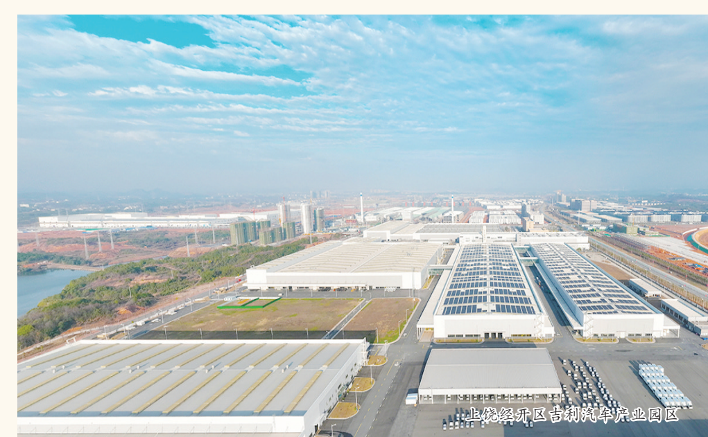
上饶经开区信义光伏玻璃产业园