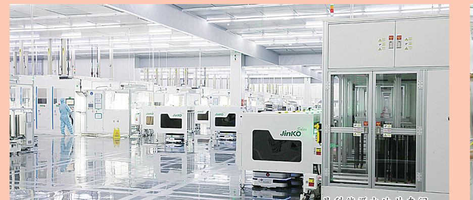
晶科能源光伏车间